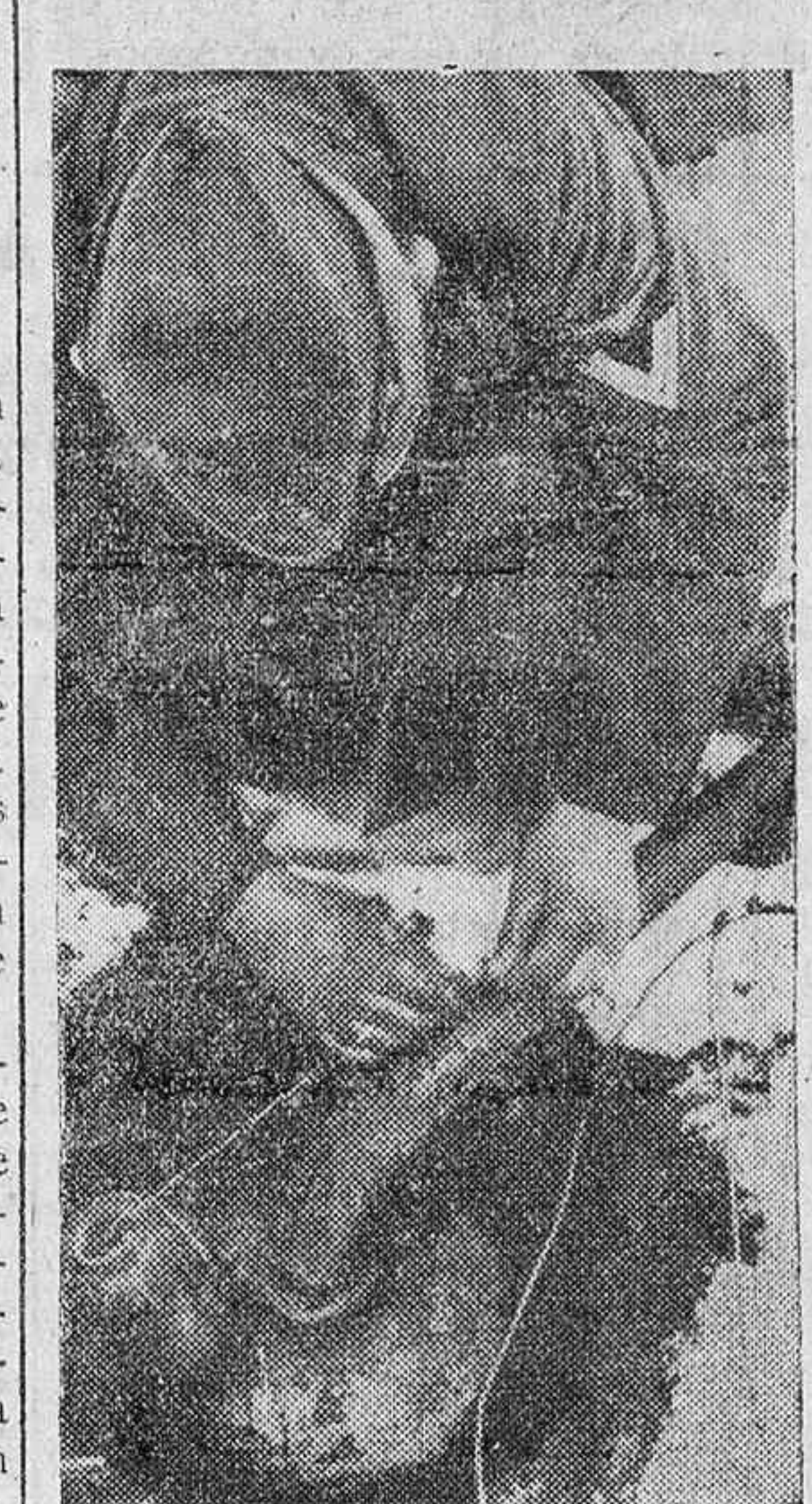
Un soldado de las S. S. germanas, preparando un lanzallamas con dispositivo eléctrico.