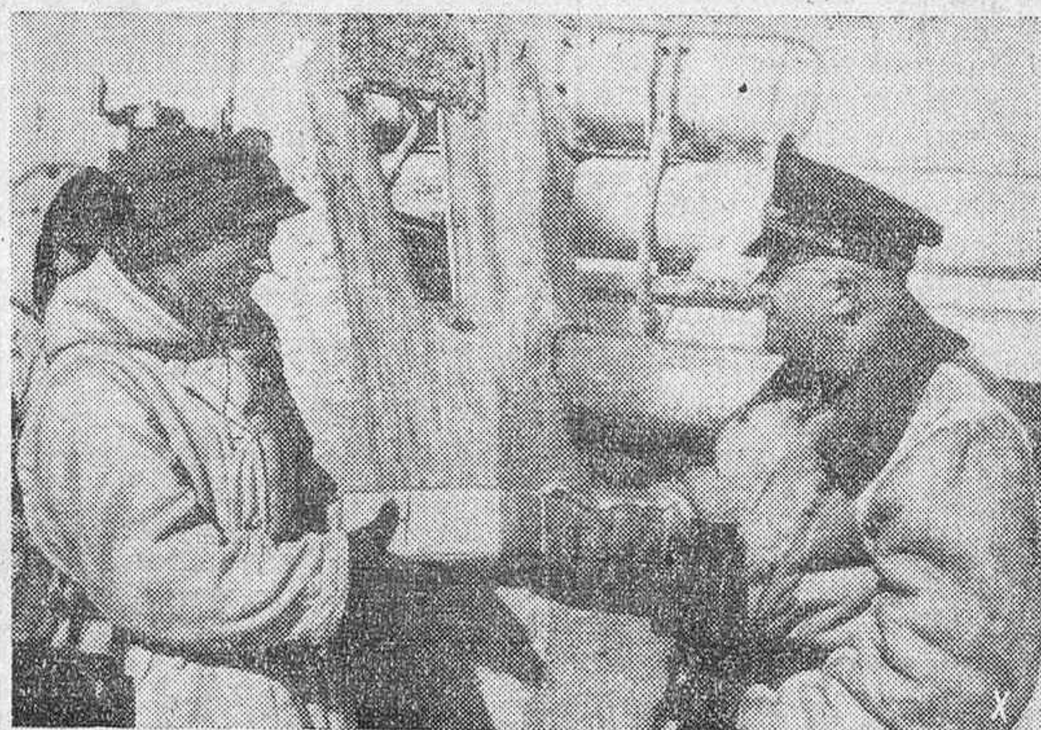
El Jefe de uno de los sectores del frente Este entrega a uno de los soldados aliados que combaten al lado de Alemania, el obsequio de sus hermanos.