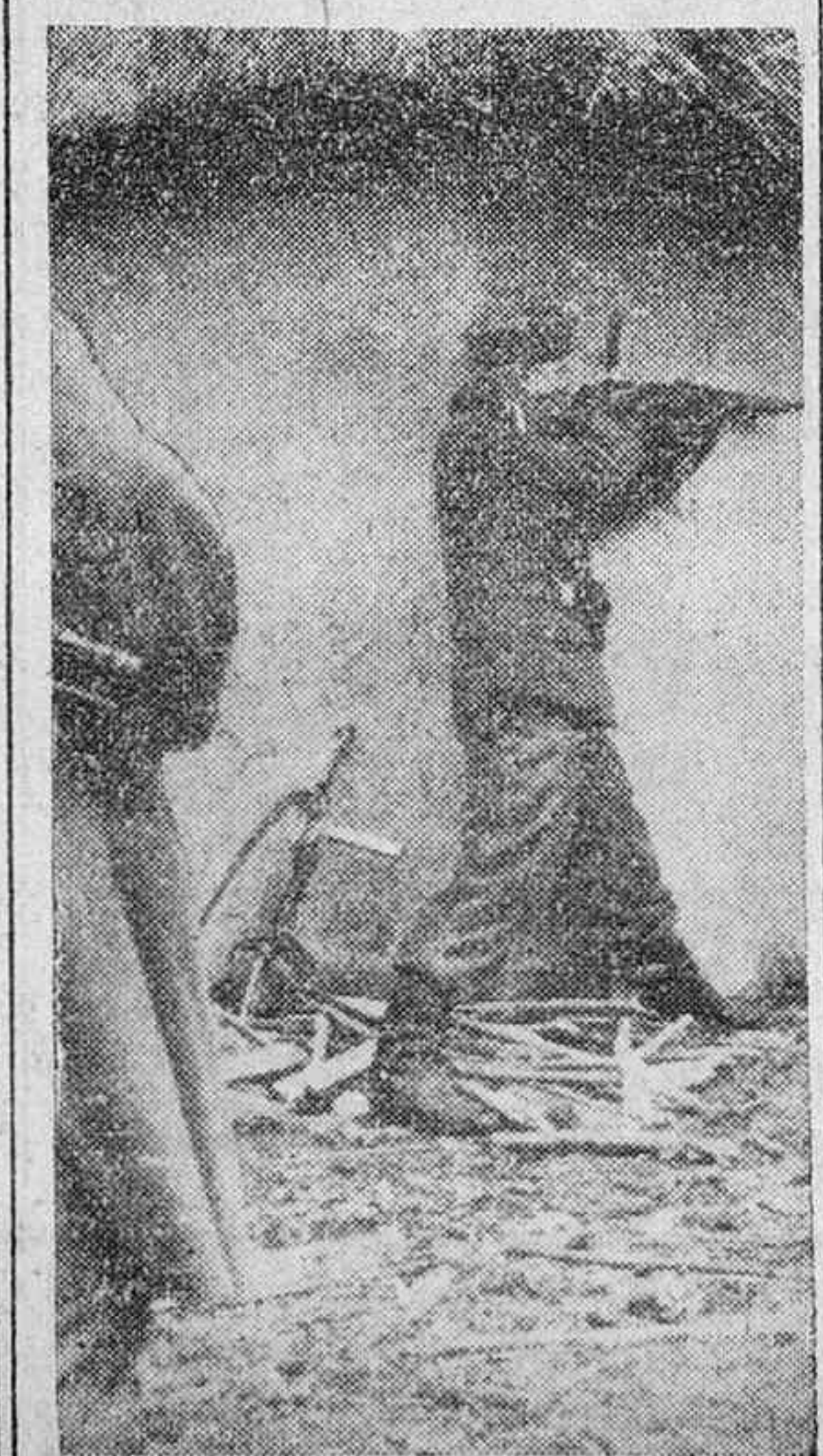
Apostado con su fusil ametrallador, un soldado alemán espera el ataque enemigo.