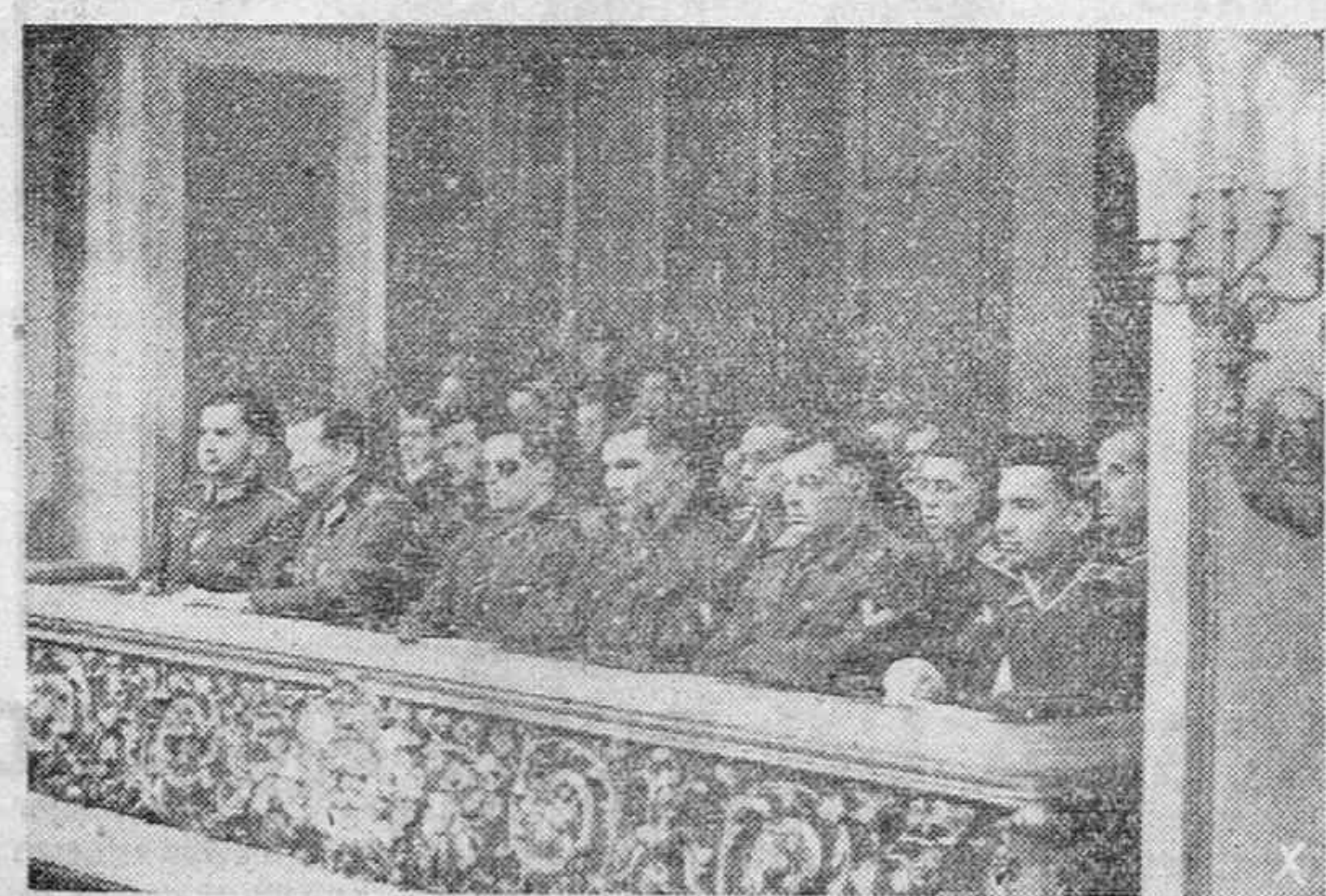
Ultimamente pronunció un discurso durante un acto del Partido, el Ministro de Propaganda del Reich, Dr. Goebbels. Como huéspedes de honor asistieron a este acto gran número de soldados alemanes heridos.