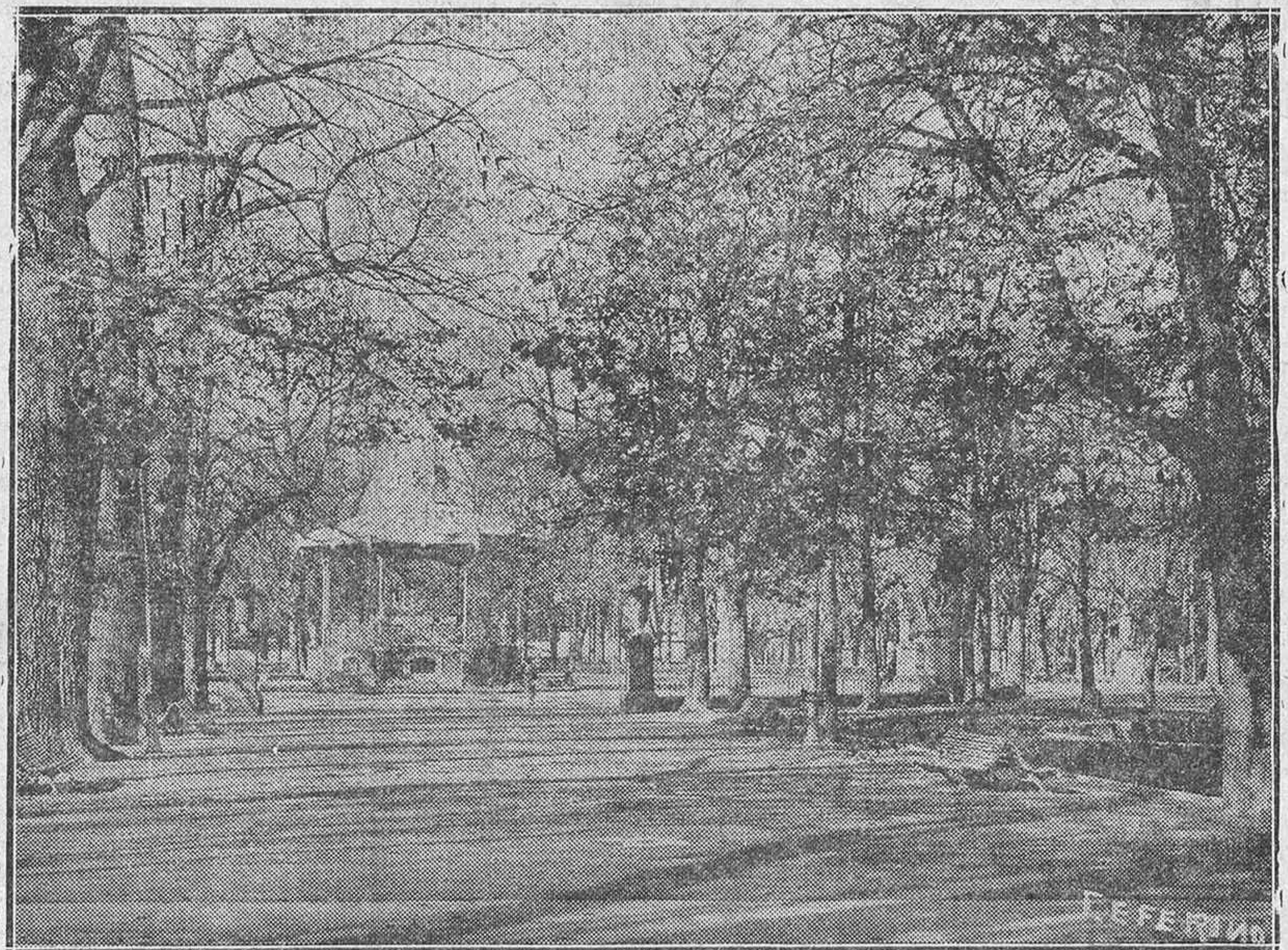
Ya está triste nuestro Parque. Triste y solo. Ellos en los fentes. Ellas, ayudándolos, trabajando también en Hospitales, Obras de Auxilio Social, y confeccionando ropas de abrigo para la próxima temporada invernal.