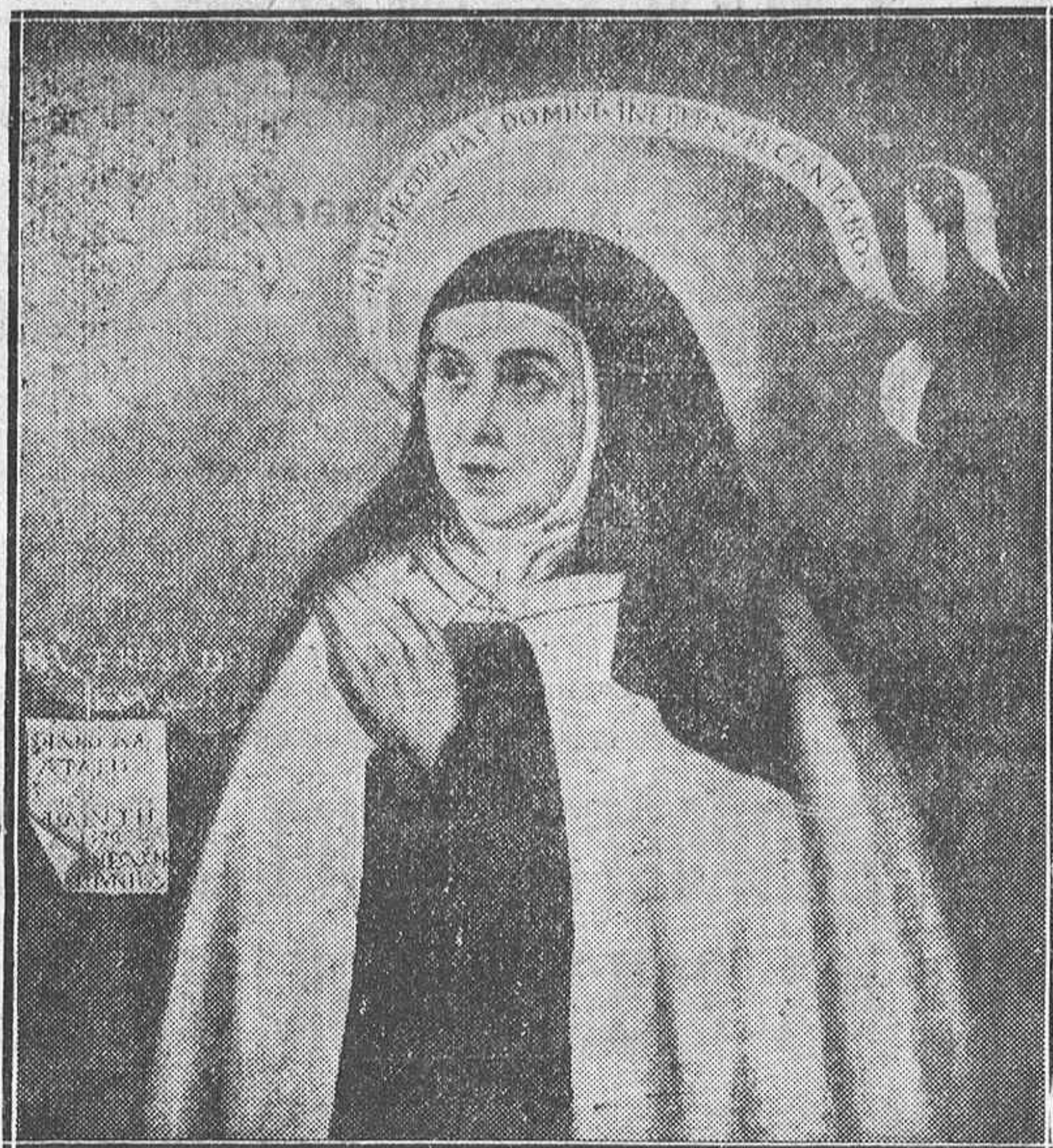
Retrato de Santa Teresa pintado por Fray Juan de la Miseria (Copia del original existente en Sevilla).

ANUNCIOS TELEGRAFICOS TARIFA Hasta quince palabras ... Ptas. 1'00 Cada palabra de aumento ... " 0'10 CONSULTE ANUNCIOS CON TARIFA REDUCIDA