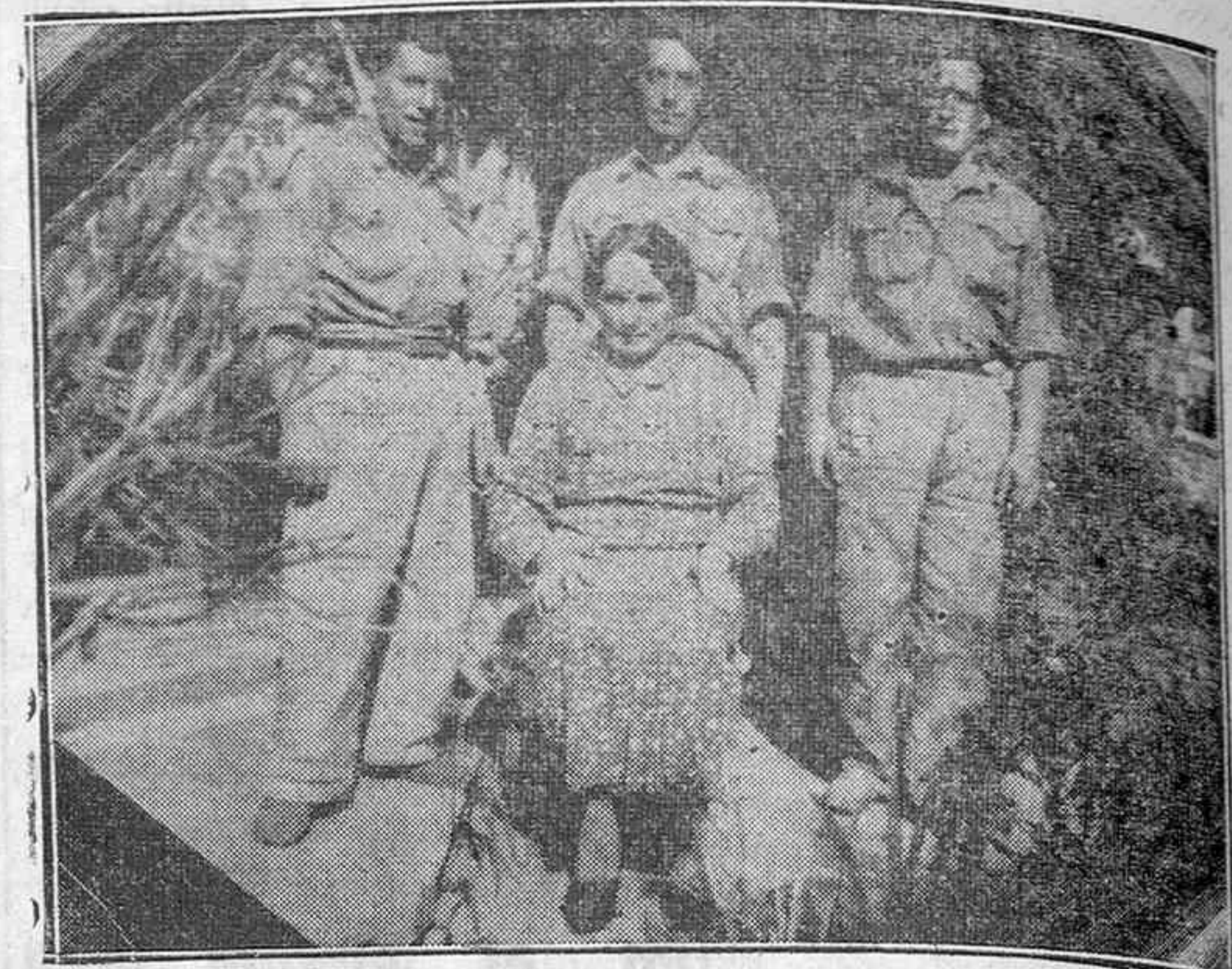
La señora de que hablábamos en nuestra información de ayer, que ha resistido todo el asedio de Villarreal, entretenida en prestar sus servicios caritativos a nuestros soldados. Esta señora es, como ya dijimos, la única persona del vecindario de Villarreal que quedó en el pueblo.

Liberada Málaga de la tiranía marxista e incorporada a la causa de la verdadera España, los laboratorios FERNANDEZ Y CANIVELL, de la citada ciudad, se complacen en poner en conocimiento del público que todas las Farmacias de Alava están surtidas de “CEREGUMIL”.