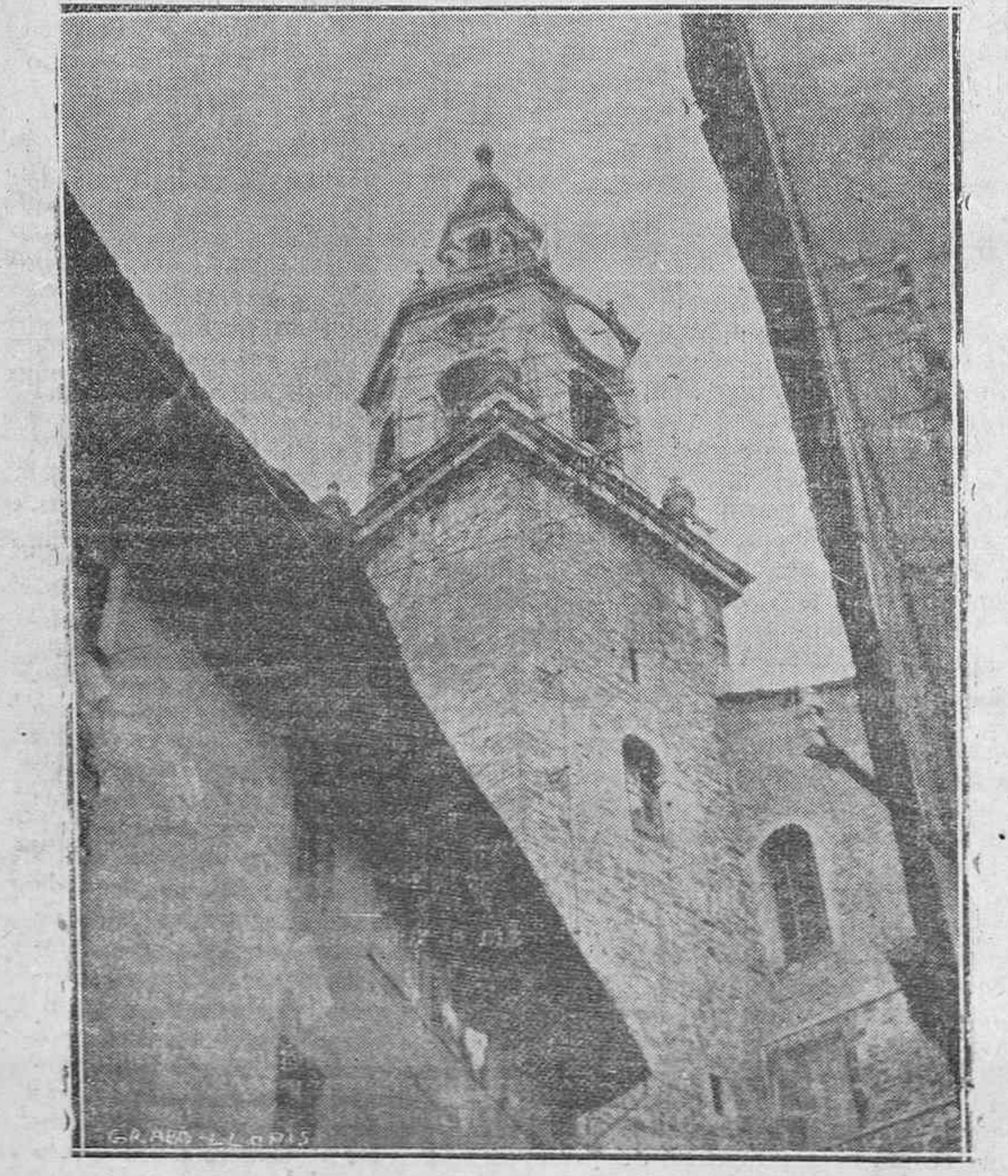
Torre de San Miguel, aguja de piedra milenaria, antena y cirio que se eleva en una perpetua oración hacia el Cielo, como un símbolo que marca la división de las dos etapas de Vitoria: la típica y la que marcha a lomos del progreso urbano. Arrancando de San Miguel, nos deslizamos por lo que fué; retrocediendo, surge lo que nace, lo que resurge, lo que nos va haciendo cada día más viejos y más sentimentales. Vitoria, la vieja, tiene el encanto melancólico de lo emocional, sobre cuyos tejados y callejuelas tortuosas, se alzan sus torres, como gigantes descabezados de Abdul Simbal, que nos hablan al alma de tiempos idos y de ilusiones que en el duro batallar de la vida se han disipado...