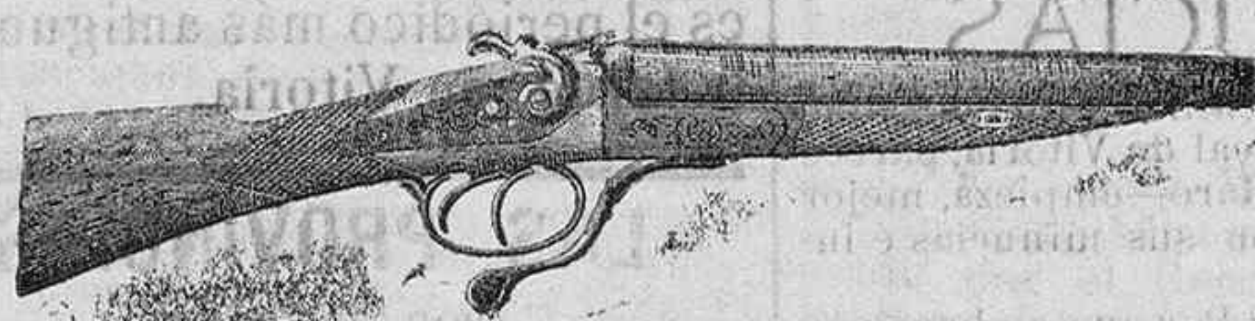
Modelo de escopeta de fuego central dos cañones, á pesetas 145 y 50