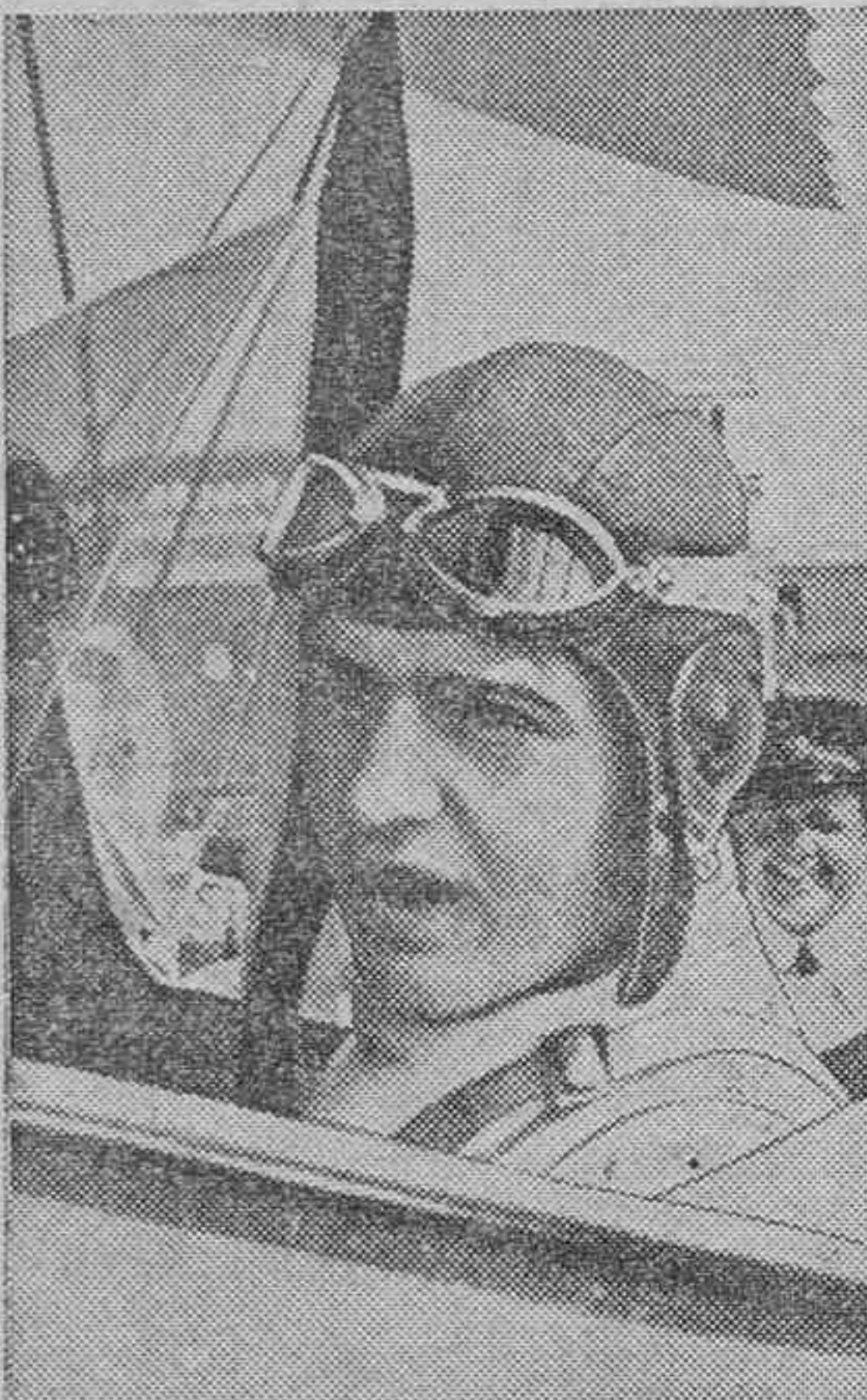
Bruno Mussolini, hijo del Duce, que pilotaba uno de los aviones que bombardearon Adua.