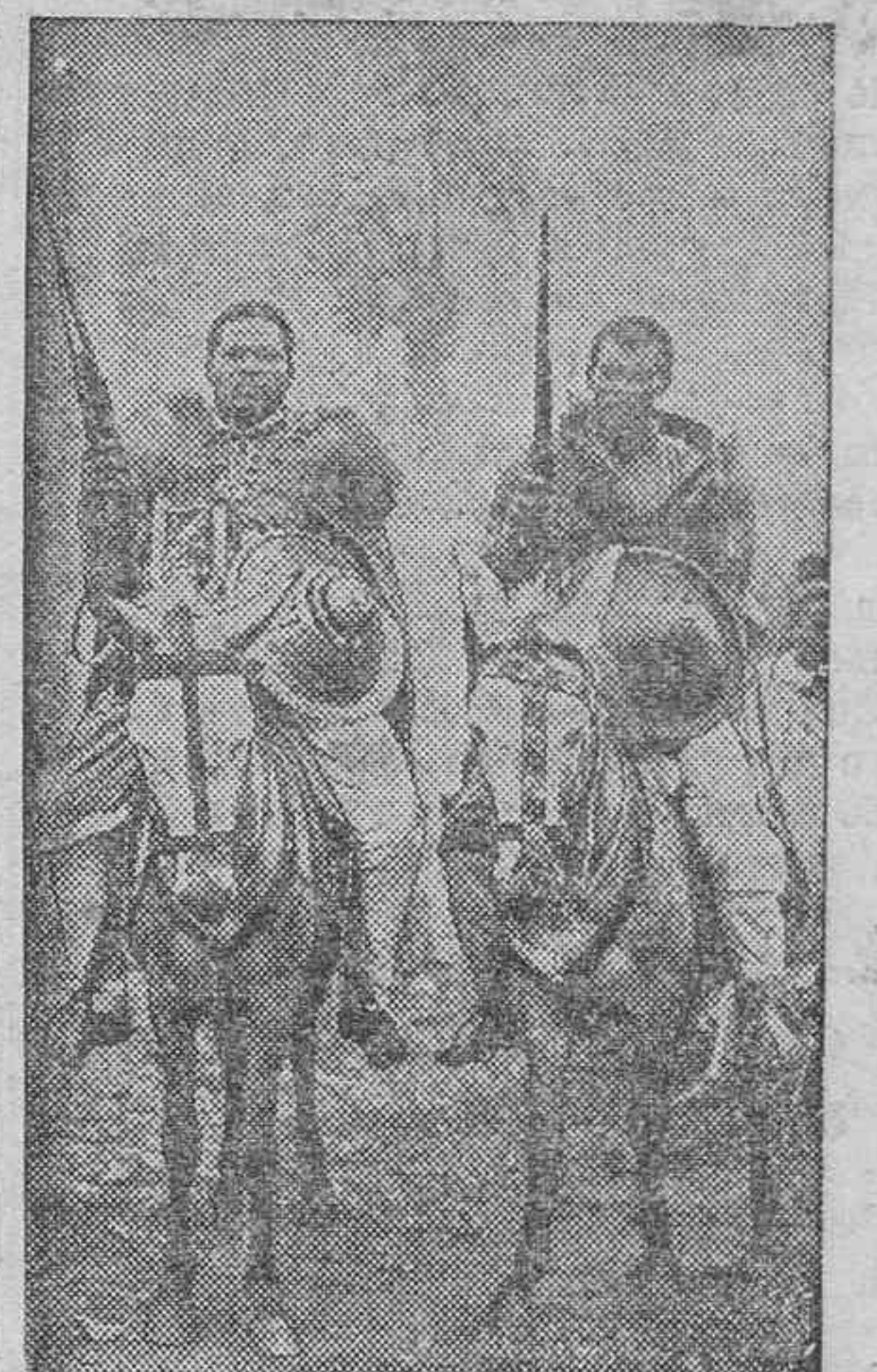
Guerreros de las fuerzas Regulares de Etiopía.