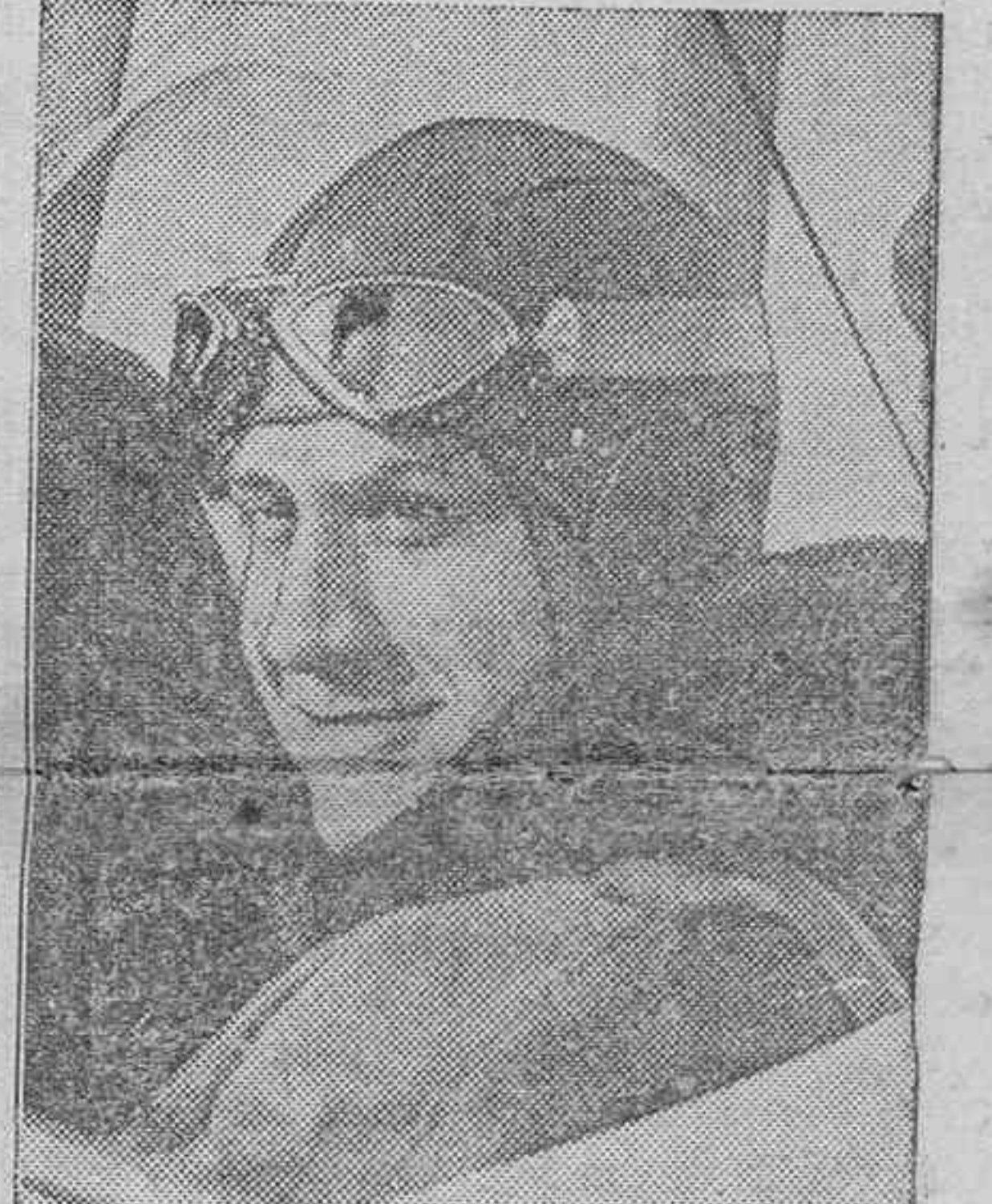
El conde Ciano, yerno de Mussolini, comandante de la escuadrilla aérea "La Desesperada", que ayer bombardeó Adua y Abigrab.