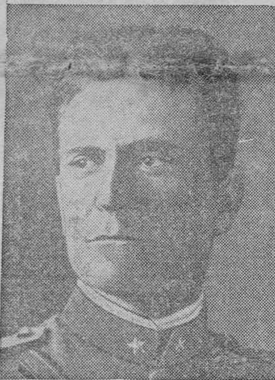
El general italiano Graziani, que manda el Cuerpo de Ejército que opera en Abisinia.