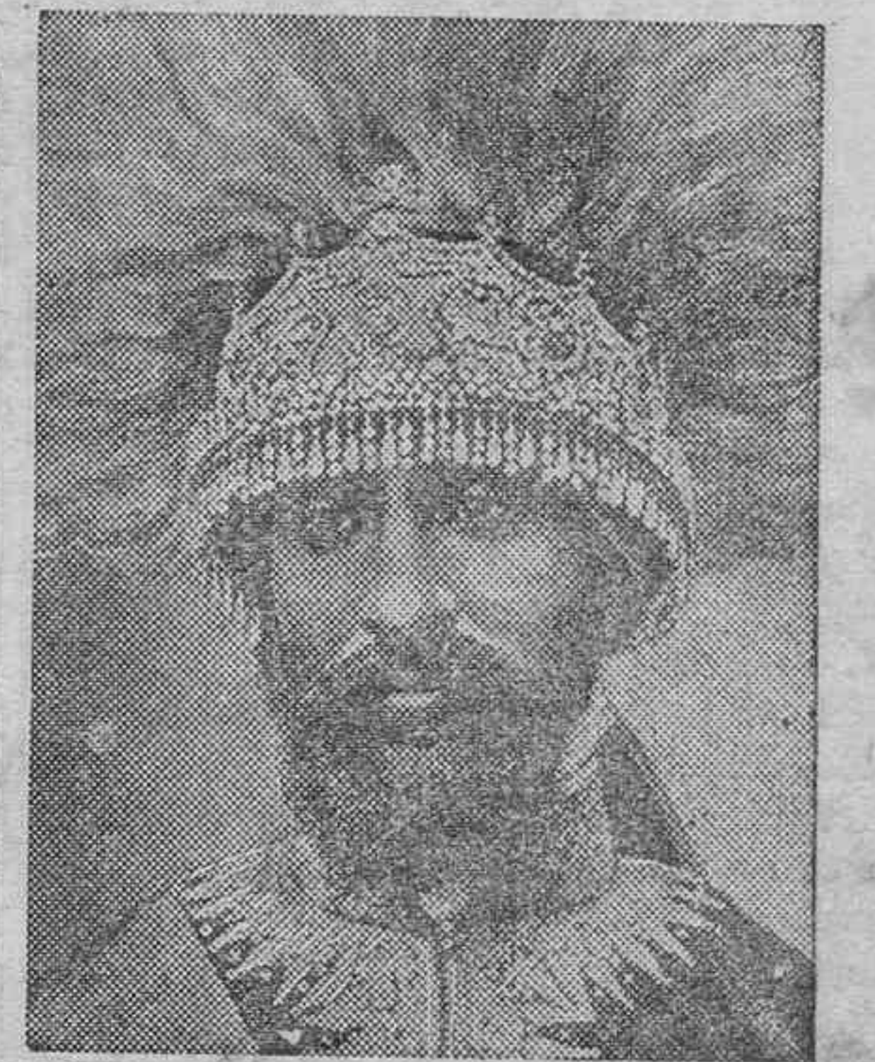
El Emperador de Abisinia

Lo mismo ocurre con Gibraltar. Sólo apoyándose en nuestra debilidad justificada Inglaterra a la necesidad de su control del Peñón. El día que España tenga baterías bastantes para garantizar ante el mundo europeo el Mediterráneo que le corresponde, Inglaterra se irá inexorablemente. Está escrito. ¿Permanecerá una hora siquiera en un imagi-