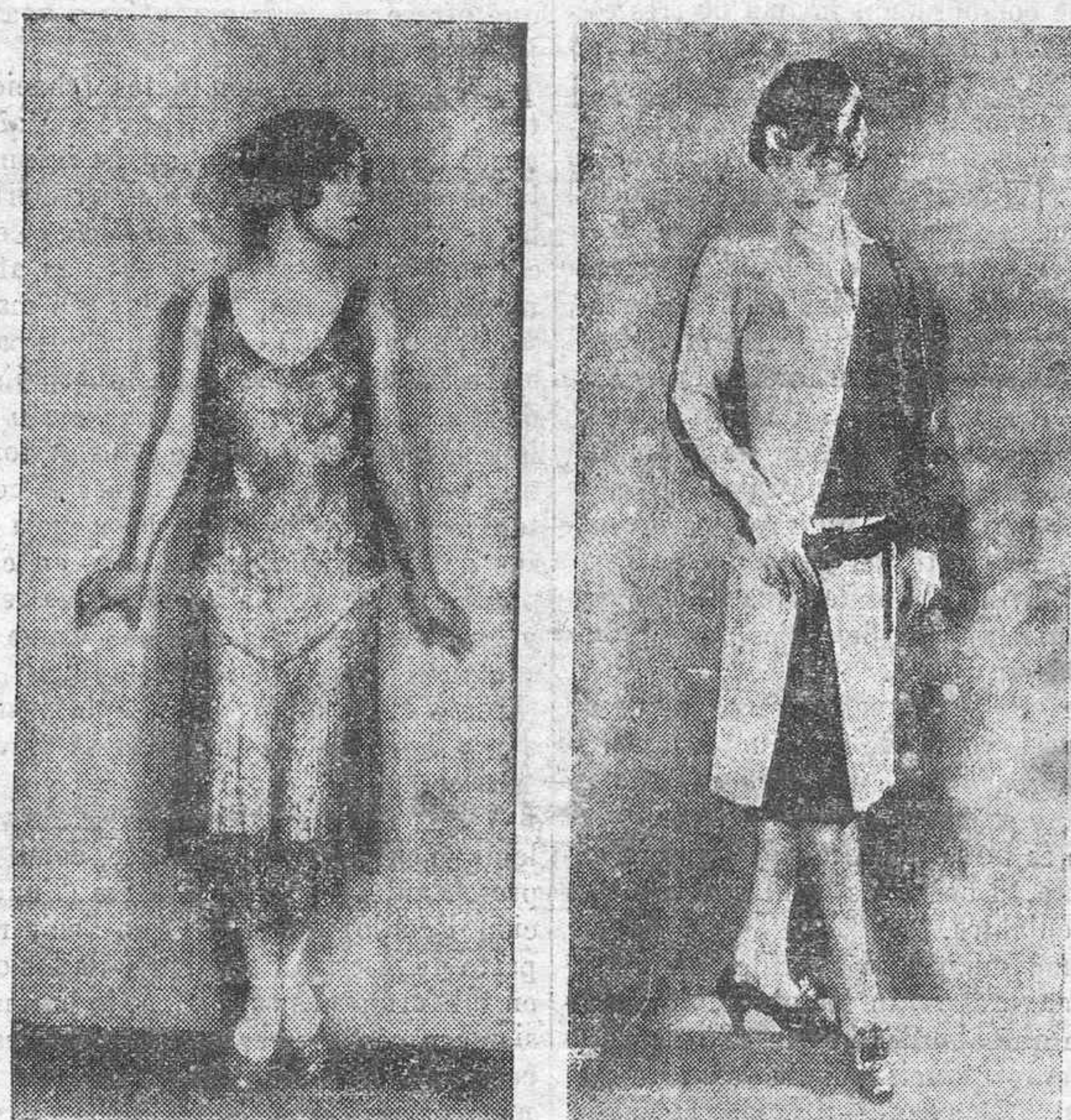
ACTUALIDADES ARTÍSTICAS.—La celebrada estrella de la pantalla, Pauline Starke, luciendo de sus más originales «toilettes»

Nadie podrá discutir ni negar, y nosotros no lo hacemos, que al fin y a la postre, cuanto se pague de nosotros mismos ha de salir; pero nadie tampoco puede suponer que, sin nuestro propio esfuerzo, sin nuestro sacrificio, esos problemas tendrán solución. Claro está que los productos que a las obras se calculan, los ha de pagar San-