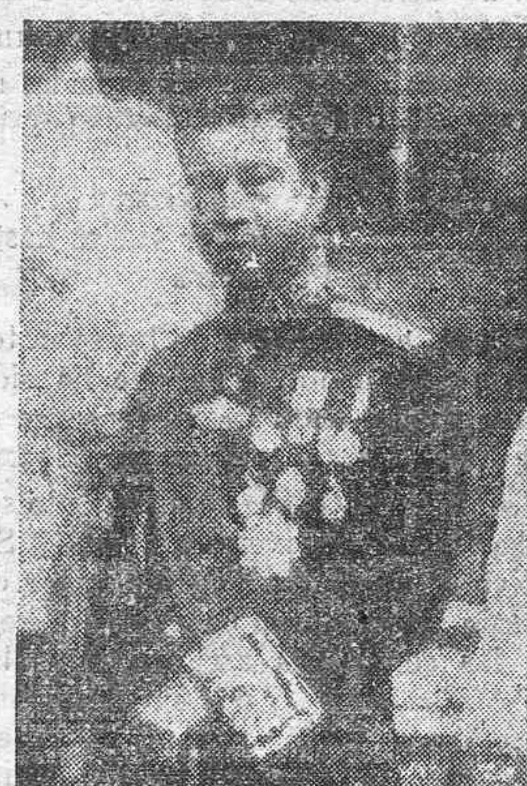
NUEVO REY.—El príncipe Monivong, que acaba de suceder al rey Sisowath en el trono de Camboya.