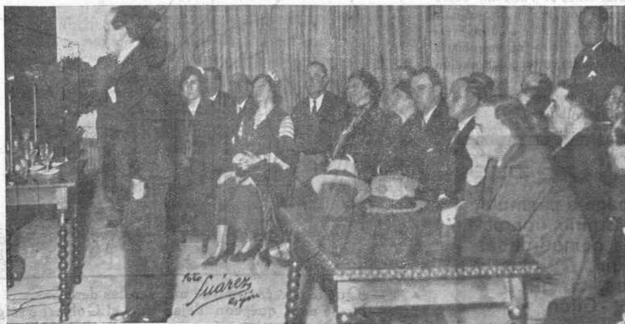
UN MOMENTO DEL MITIN.—El señor Gil Robles dirigiendo la palabra a la muchedumbre y ante la mesa que presidió el acto. En primer término, a la derecha, aparecen los señores Alvargonzález y Ladreda y seguidamente las Presidentas de Acción Popular de Oviedo y Gijón.