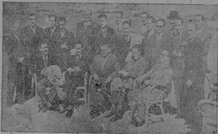
Los periodistas barceloneses y sus acompañantes en la terraza del Mediterráneo Hotel