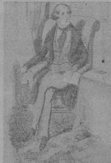
Retrato de Carlos Dickens cuando tenía 26 años, por George Cruikshank

La elasticidad de su alma no le impidió, sin embargo, de ser implacable moralista. Dickens forjó un arte, un estilo y un humor a veces extravagantes, pero que han quedado a través de los tiempos y de las generaciones. Optó siempre por apelar a la sensibilidad antes que al pensamiento. Hay en su imaginación algo de magníficamente pueril, es decir, inmune al estrago, que cautiva y que deja huella. Dickens fué uno de los que introdujeron a la industrializada Inglaterra en la esfera —llena de color y sabor, de esa pequeña filosofía y psicología de la vida de cada día— de la novela.