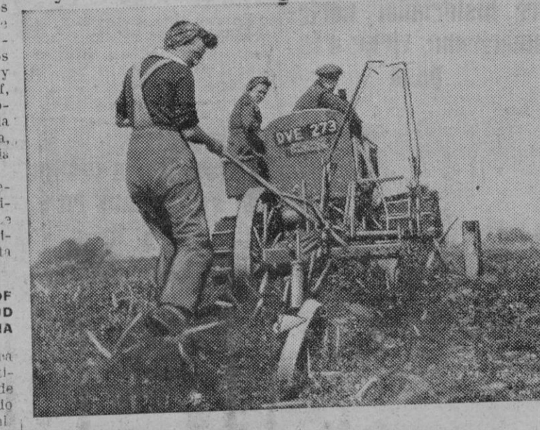
Centenares de acres de tierra baldía están siendo preparadas para ser cultivadas en gran escala. En esta fotografía vemos un tractor, en plena labor, trabajando en el condado de Cambridgeshire.

Se refiere luego al ambiente normalidad en que se vive la vida en Barcelona, en contraste con las condiciones de vida que en el extranjero se hacen contra España.