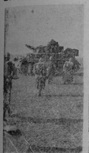
Tanques e infantes norteamericanos tomando posiciones, después de desembarcar, para entrar en combate