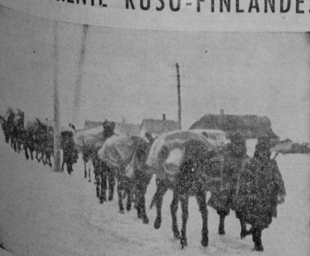
Un convoy a lomo, de municiones y viveres, con destino a la primera línea de fuego finlandesa atraviesa una pequeña aldea de la Carelia septentrional