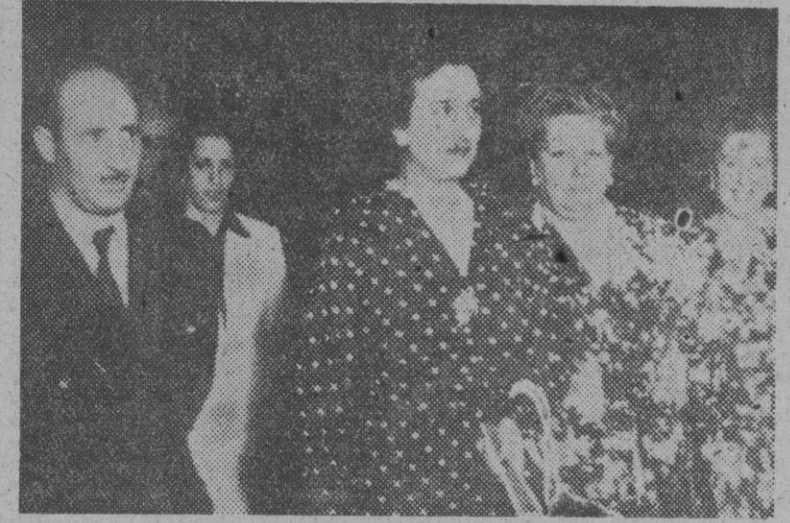
La esposa de S. E. el Jefe del Estado, acompañada de la marquesa de Huétor de Santillán y del gobernador civil de la provincia, en su reciente visita a aquella ciudad.

Los servicios del puerto de Londres están amenazados de absoluta paralización