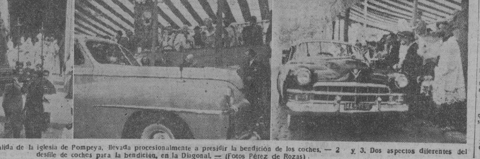
La imagen de San Cristóbal, a la salida de la iglesia de Pompeya, llevada procesionalmente a presidir la bendición de los coches. — 2 y 3. Dos aspectos diferentes del desfile de coches para la bendición, en la Diagonal. — (Fotos Pérez de Rozas)