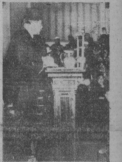
El primer ministro egipcio, Nokrachi Pacha, dirige la palabra al Parlamento anunciando la interrupción de negociaciones con Inglaterra para la revisión del Tratado de 1936 y su decisión de someter el caso al Consejo de Seguridad de la UNO.

DOS NICARAGUENSES DETENIDOS POR CONTRABANDO DE ARMAS