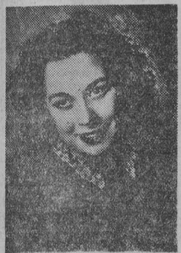
FIGURA DEL TEATRO