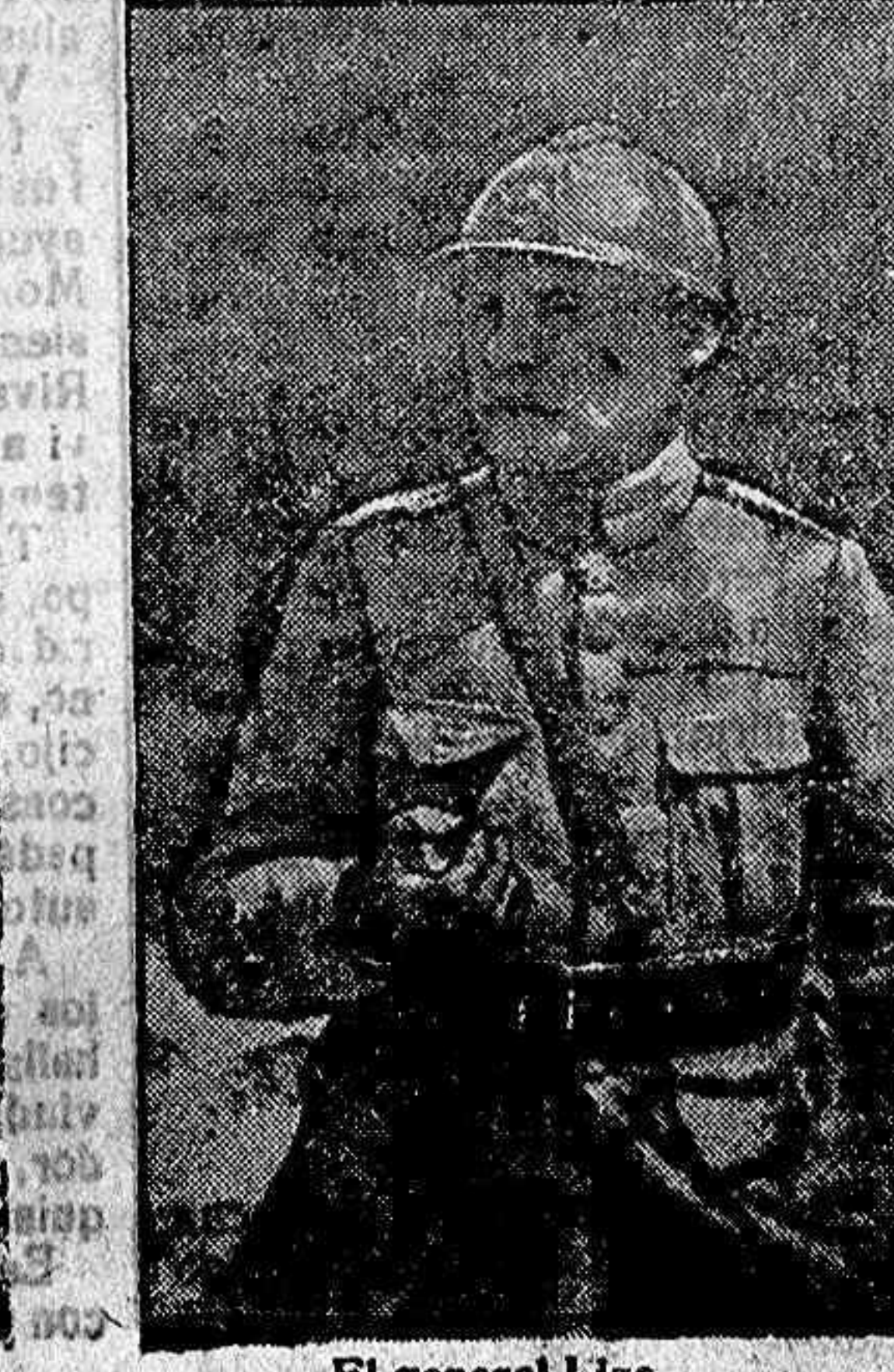
El general Lize.