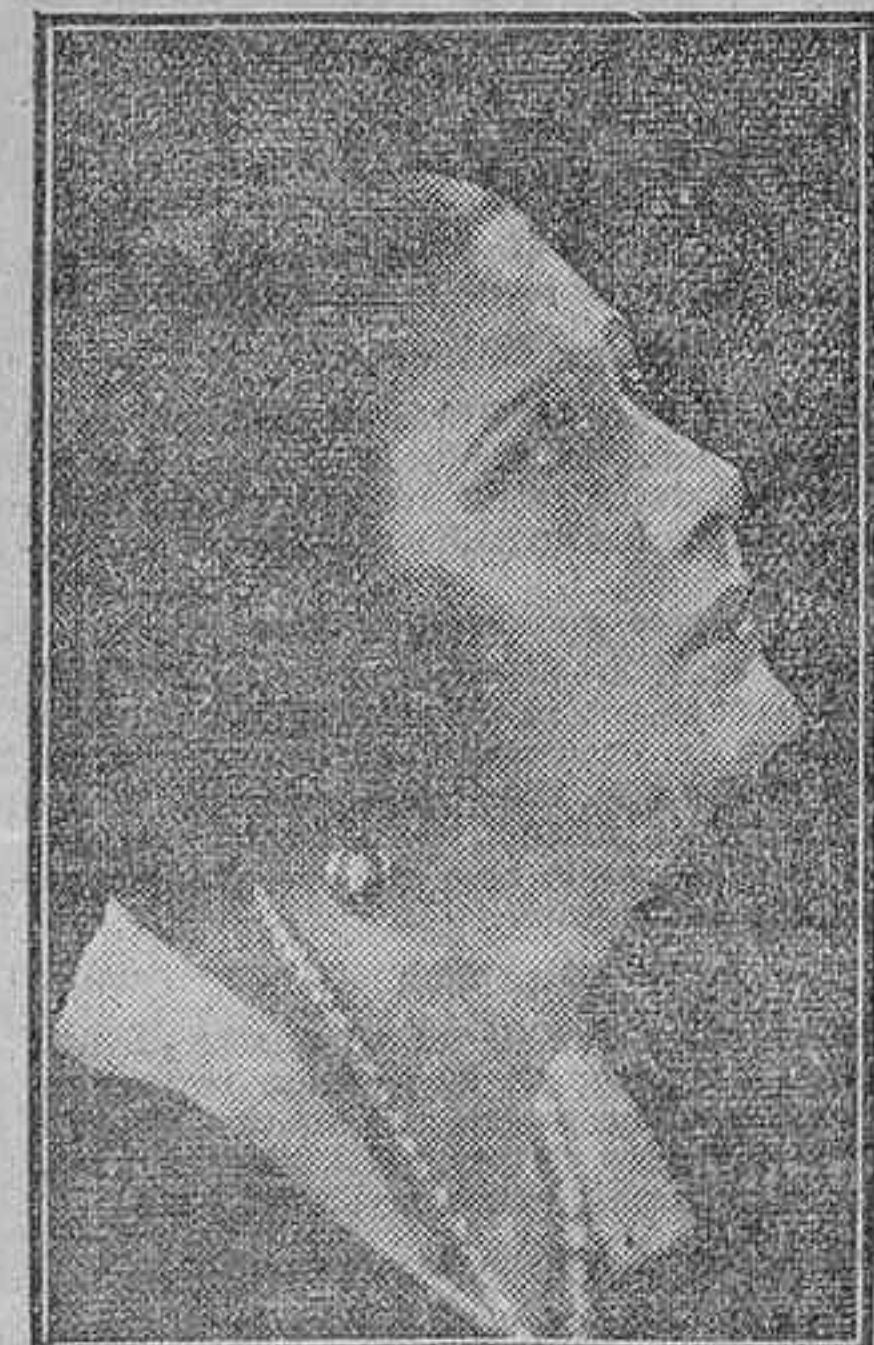
Celia Escudero, celebrada actriz de nuestra cinematografía

Hemos recibido un ejemplar del número de «Fotogramas» que mañana se pondrá a la venta y que como los anteriores contiene trabajos selectos e interesantes, avalorados por una esmerada y artística presentación.