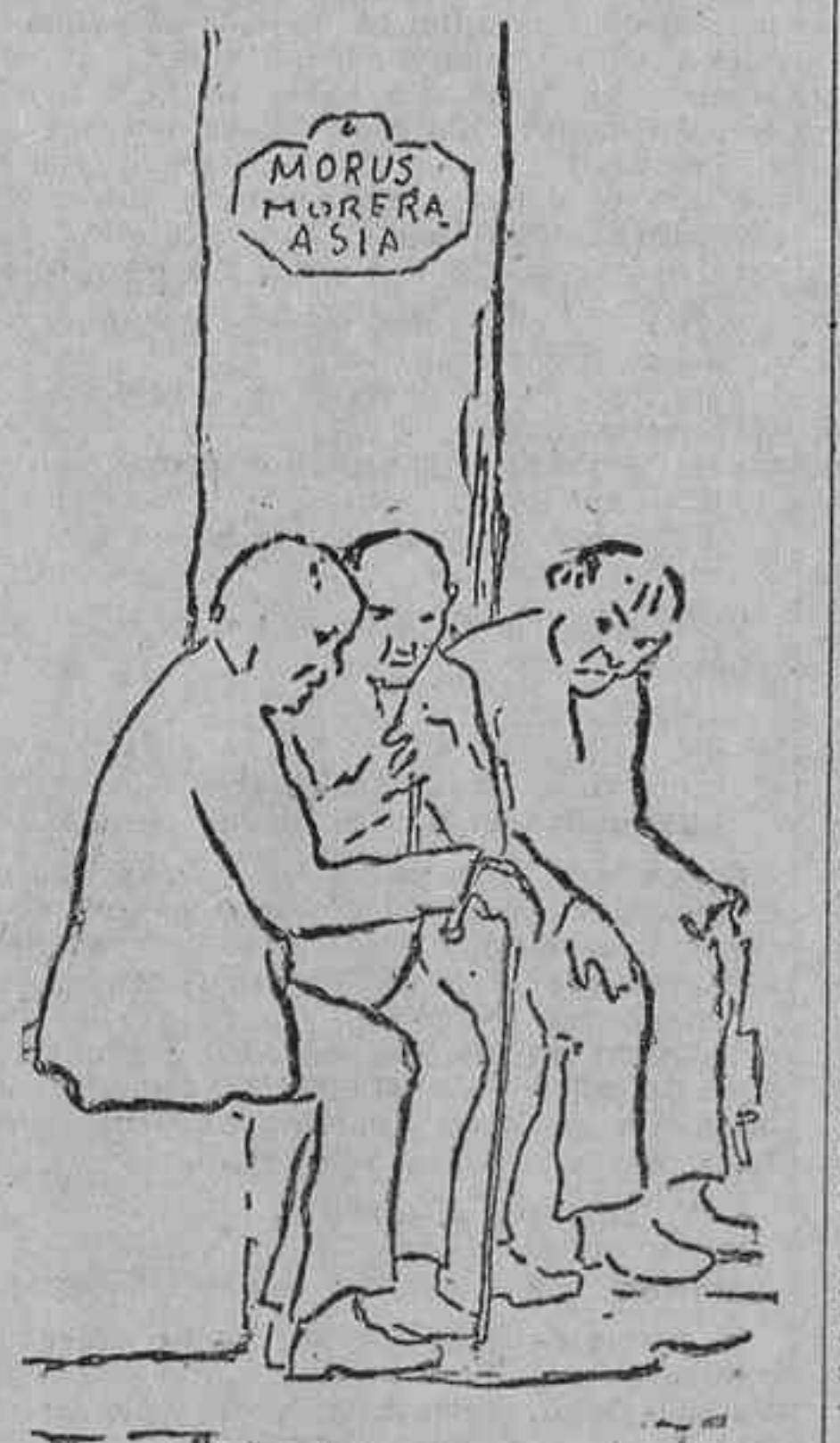
ESTAMOS EN EL PASEO CENTRAL... En el paseo que allí arriba preside el busto de Linneo, donde las ramas de los árboles, al cruzarse, han formado un tupido toldo.