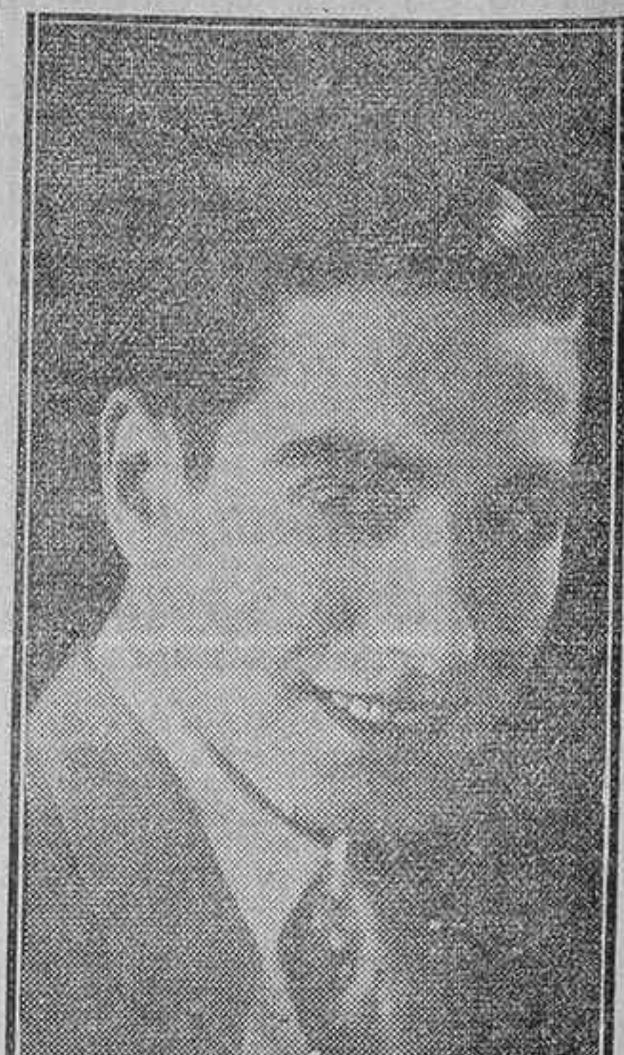
El notable actor cinematográfico José Nieto