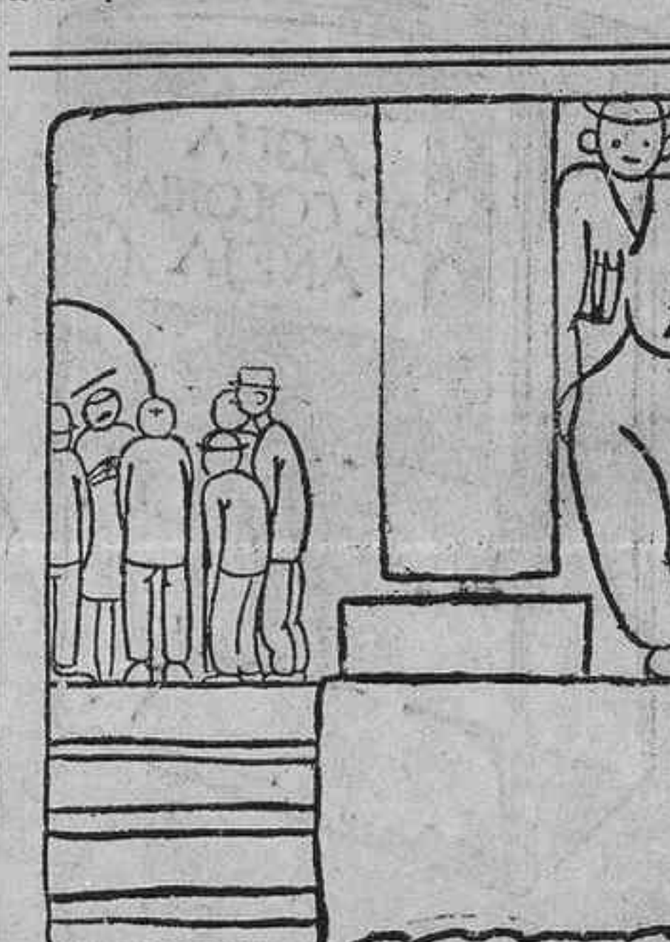
--¿Otro suspenso? Chico, tienes que reformarte. --Ahora, ahora nos reformarán a todos.

Sevilla, 28.—En la mina «Aldea del Serrano» estalló un cartucho de dinamita, en el pozo número 33.