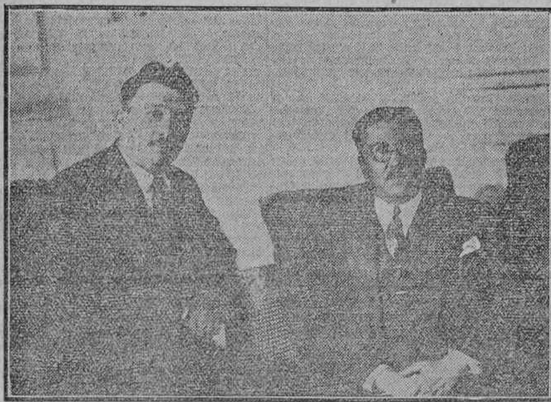
EL MINISTRO DE MÉJICO DURANTE SU ENTREVISTA CON ALFONSO CAMÍN

que añanzar mucho más el concepto de nacionalidad, tan arraigado en Méjico. —Y qué opina usted de la literatura criolla, comenzada en la poética por Ramón López Velarde?