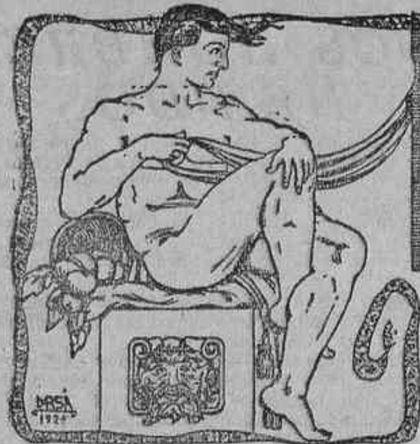
EL COMPLEMENTO DE ESTAS PAGINAS