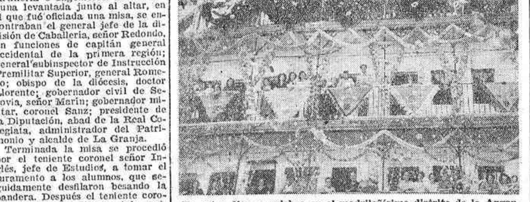
En estos días se celebra en el madrileño distrito de la Arganzuela la clásica verbenas de San Cayetano, su Patrón, y los vecinos de la barriada han rivalizado en adornar sus terrazas y balcones, como en este patio, que tan bonito aspecto presenta con sus farolillos, guirnaldas y mantones de papel.

Por Francisco CASARES. Si hay algo que no acaba de ser definido, que no alcanza resueltas fórmulas de concreción, es el sentimiento de la amistad. Nada tan incoercible y hambocato. La expresión "mi querido amigo" en la correspondencia es un cliché que se repite en muchos casos, sin que de verdad exista una relación o vínculo que la justifique.