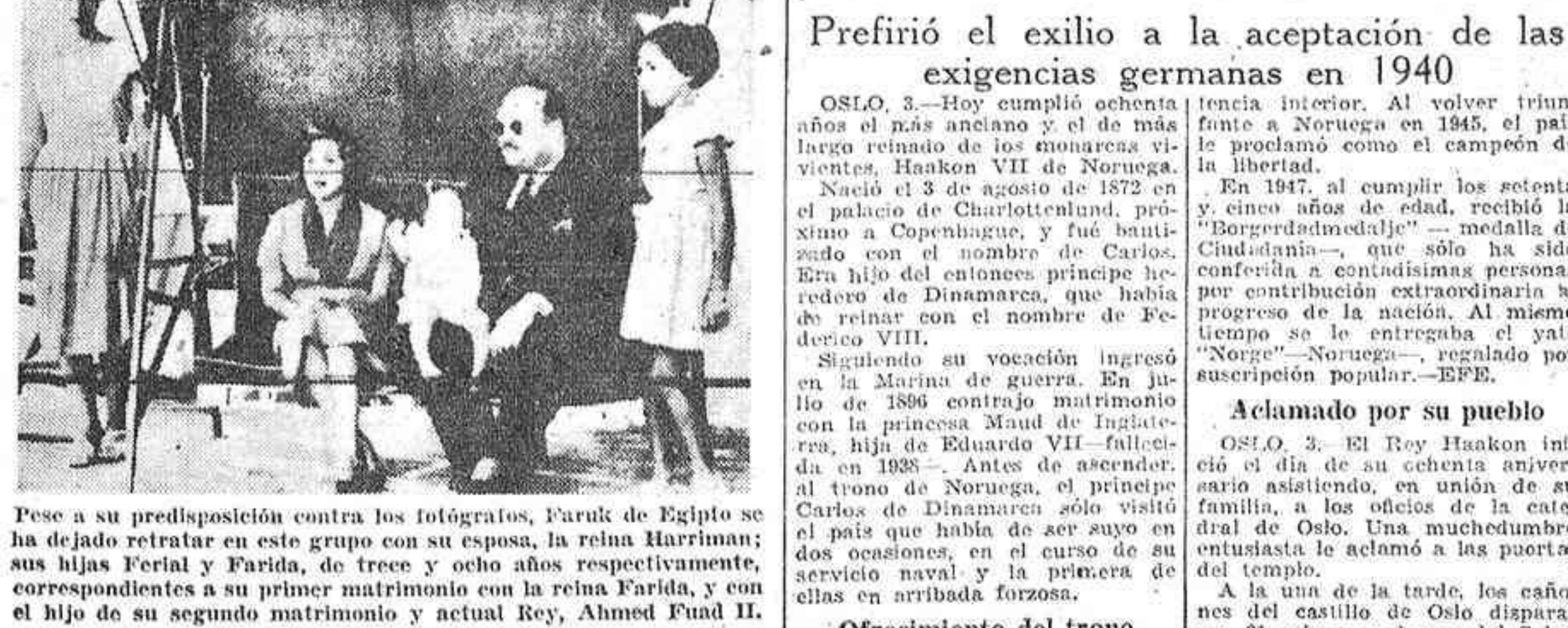
Pese a su predisposición contra los fotografías, Faruk de Egipto se ha dejado retratar en este grupo con su esposa, la reina Hafz...

Llamamiento de Naguib a las potencias mediterráneas para una "era de comprensión y cooperación"