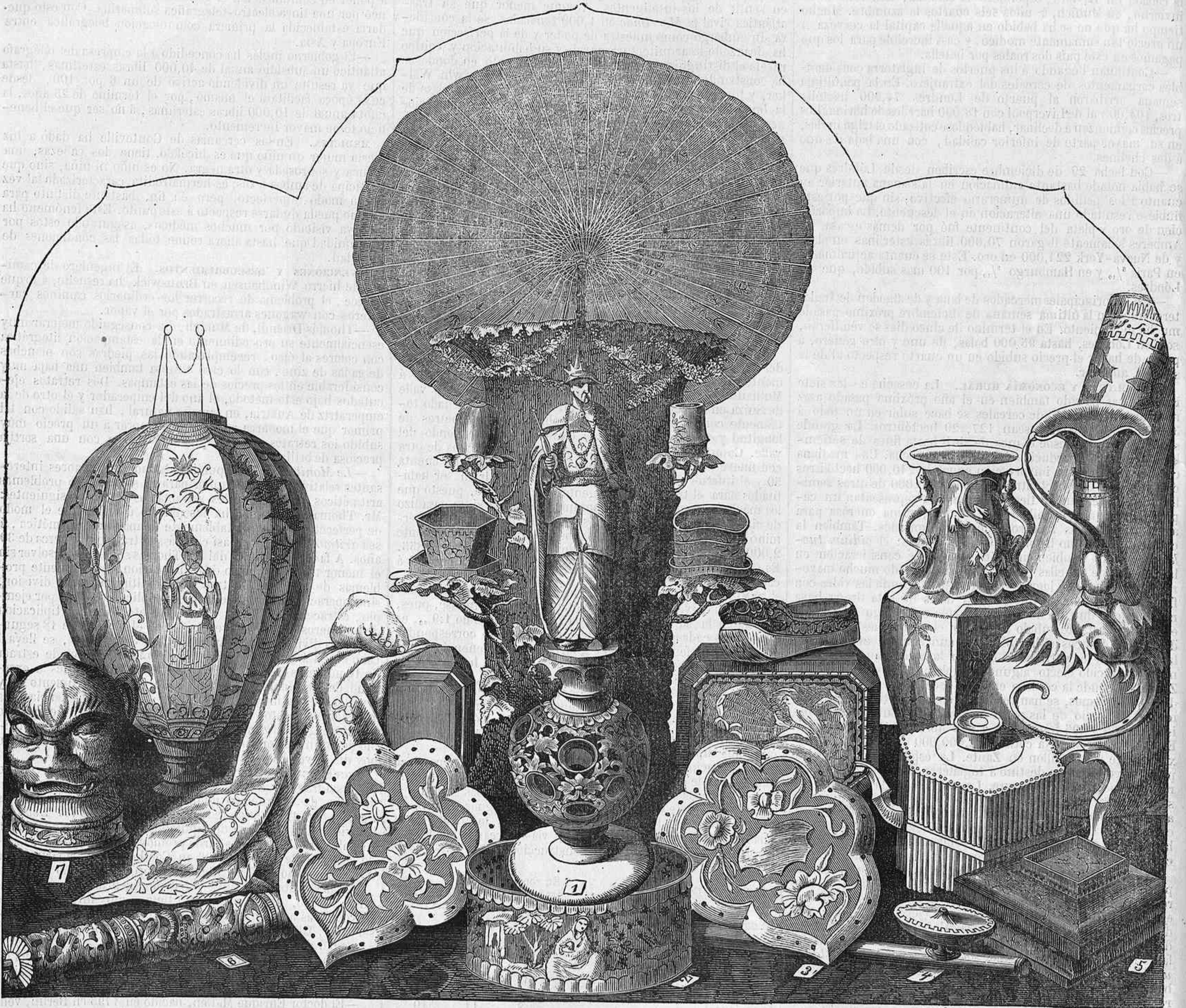
Exposicion de objetos industriales de la China y del Japon en Berlin.—(Véase la pág. 7.)

La lucha electoral fue muy acalorada y empeñada. Vamos á trazar un cuadro relativo al acto de eleccion verificado en Nueva-York, basado en datos que ha suministrado un testigo presencial. Ya desde muy temprano reunióse en los sitios designados para deponer los votos un cúmulo de electores, y delante de los polls (urnas) ocurrieron todas aquellas escenas que en América suelen por lo regular sobrevenir en semejantes ocasiones. La atmósfera, con el extraordinario calor que hacia, estaba bastante cargada. Los puestos en que se habian