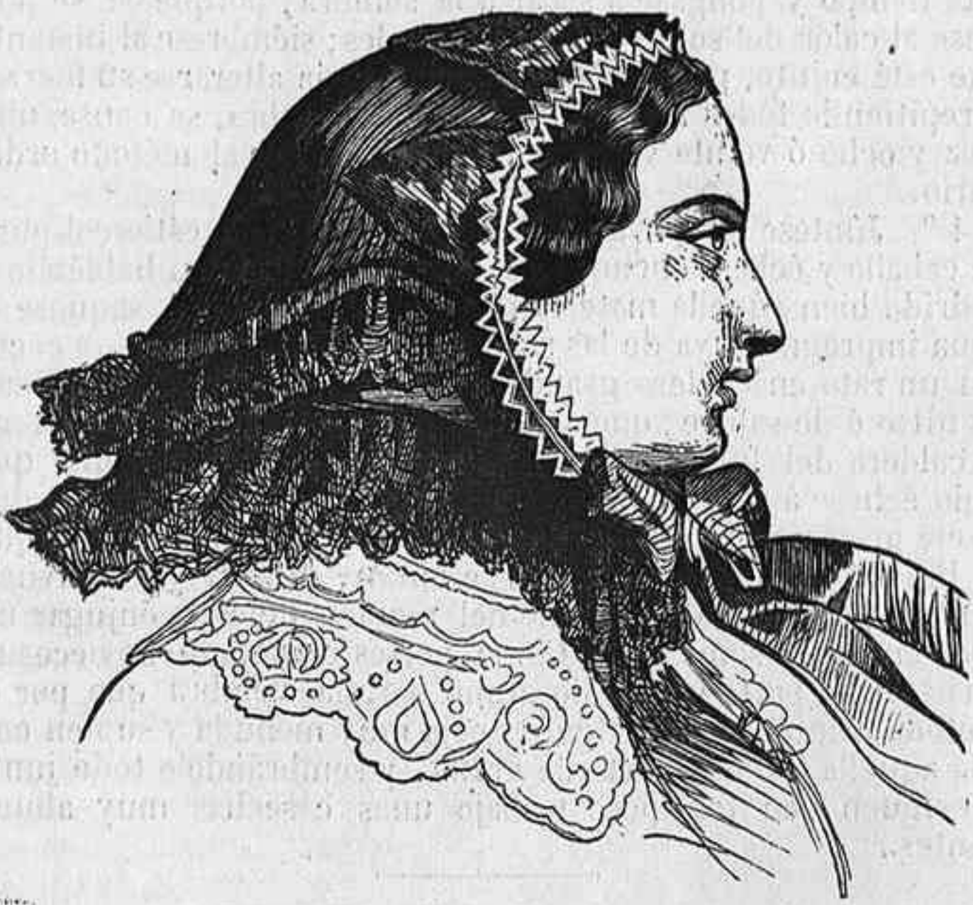
Sombbrero de raso color de violeta.

animal son innecesarios para la producción de la fosforescencia.