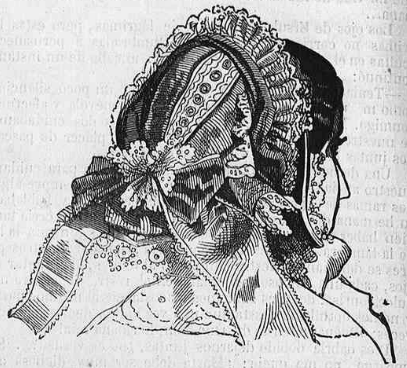
Sombbrero de reps para invierno.

Avocadas á la temporada de los grandes bailes, muchas damas, amantes de esta diversion, se preguntarán á sí mismas