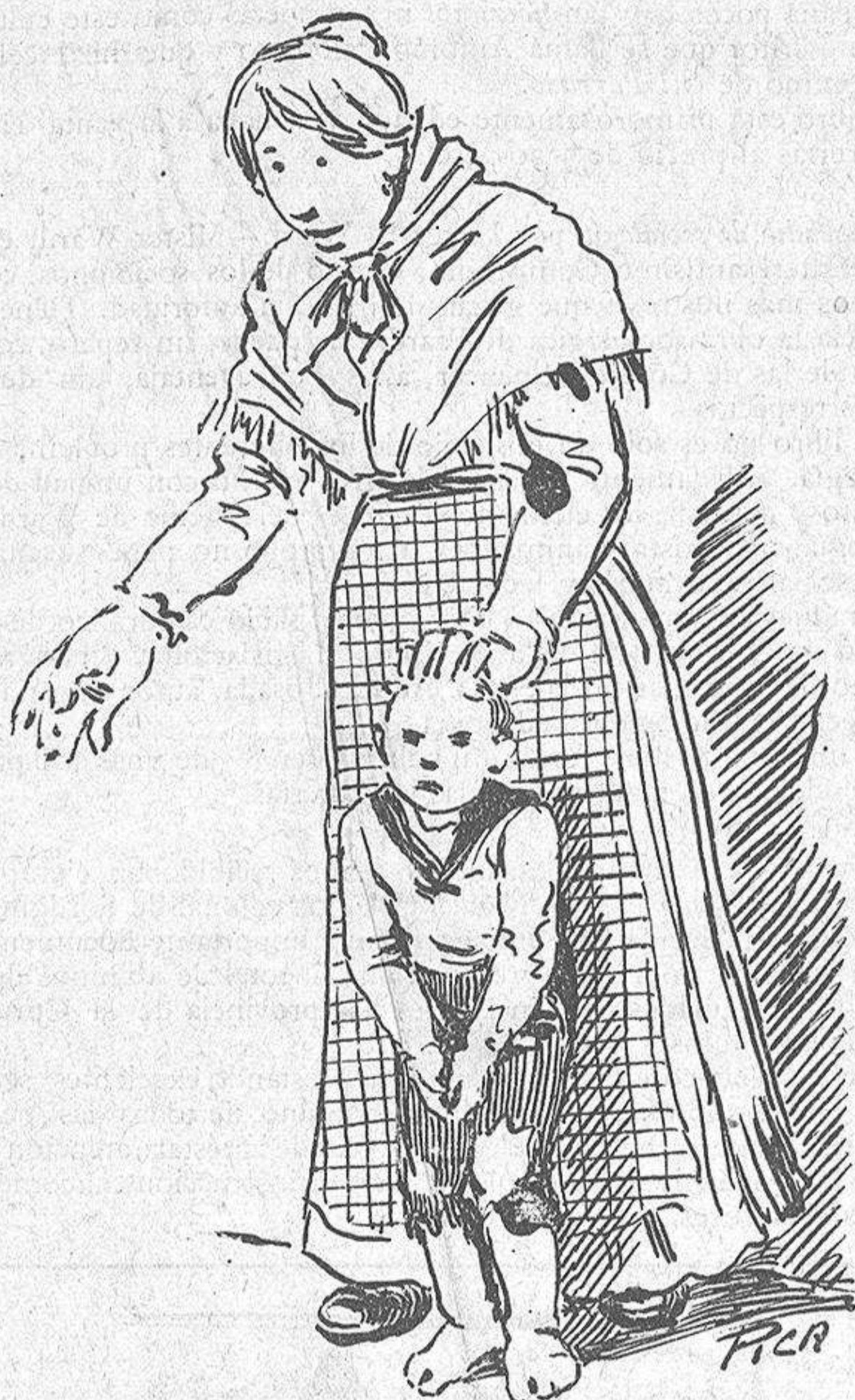
La Voz de Galicia

A la puerta del cielo venden zapatos. Por eso hay en el mundo niños descalzos.