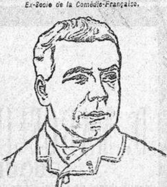
Atestado de M. Coquelín aine

He usado sus Pastillas y me fueron verdaderamente benéficas. Le ruego se sirva mandarme todavía algunos atestados. V. queda autorizado para publicar estas líneas. Sea de V., etc.