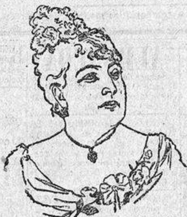
Atestado de M te Thérèse

Desde el momento que uso sus Pastillas Géraudel me hallé en perfecto estado de salud. Mi constipado ha desaparecido totalmente y tambien siento mi voz los efectos benéficos de su preparado. En el porvenir podré cantar los méritos de las Pastillas Géraudel y eso con voz tanto mas fuerte que á la de la naturaleza cuando la voz del aveido.