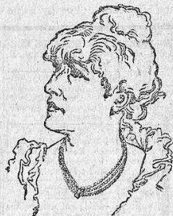
Atestado de M te Sarah Bernhardt

Ya vienen los primeros rios. Hagame pues el favor de enviarme una nueva provision de Pastillas Géraudel. Compliments.