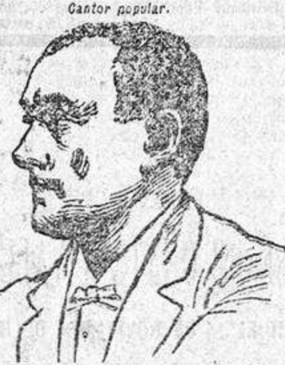
Atestado de M. Paulus

Demostreneis chupaba guitarras para destigarse la lengua. Tomó en la mesa para preservarme la voz uno de la propiedad Paulus y al decirlo contra los vientos encorruados, Pastillas Géraudel. Proiedad Paulus y Pastillas Géraudel, no hay ni secreto. Sus Pastillas, cara Señor, han sido verdaderamente útiles á mis cuerdas vocales.