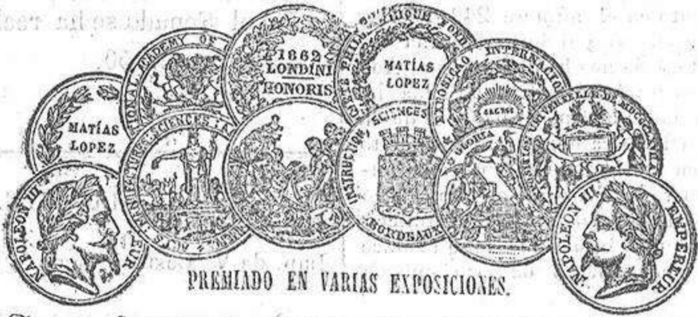
PREMIADO EN VARIAS EXPOSICIONES.

Los remedios se venden en cajas y botes, por todos los principales boticarios del mundo entero, y por su propietario, el PROFESOR HOLLOWAY, en su establecimiento central, 533, Oxford Street: (antes 244, Strand,) Londres.