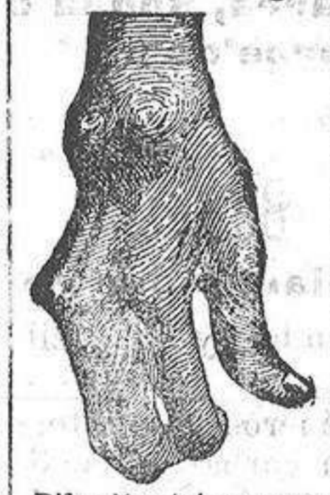
Difformidad de la mano en un reumatismo articular crónico. Tipo No. 2.