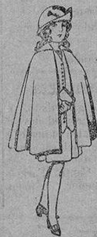
Capas de lana para niñas de 4 a 12 años De 20 a 22 ptas.