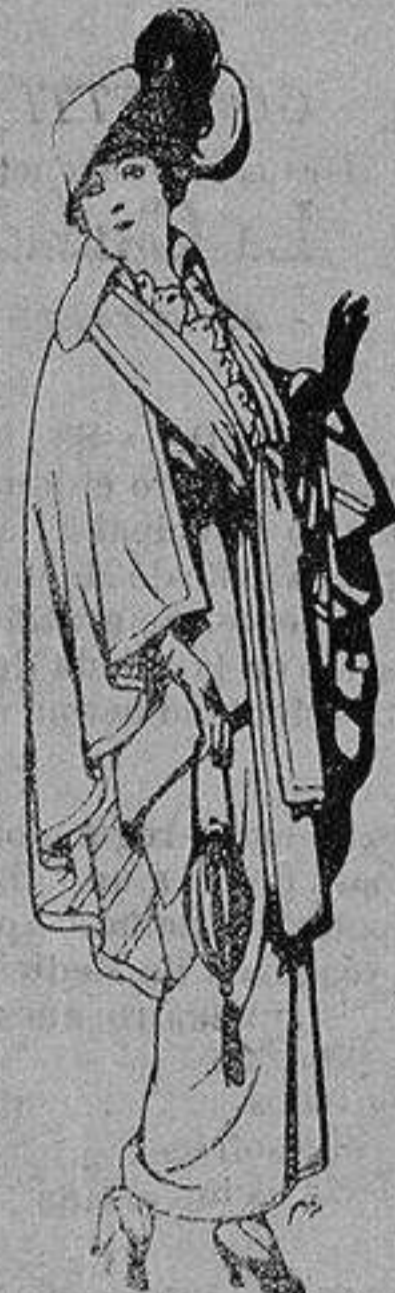
Capas de lana para señora A 20 ptas.