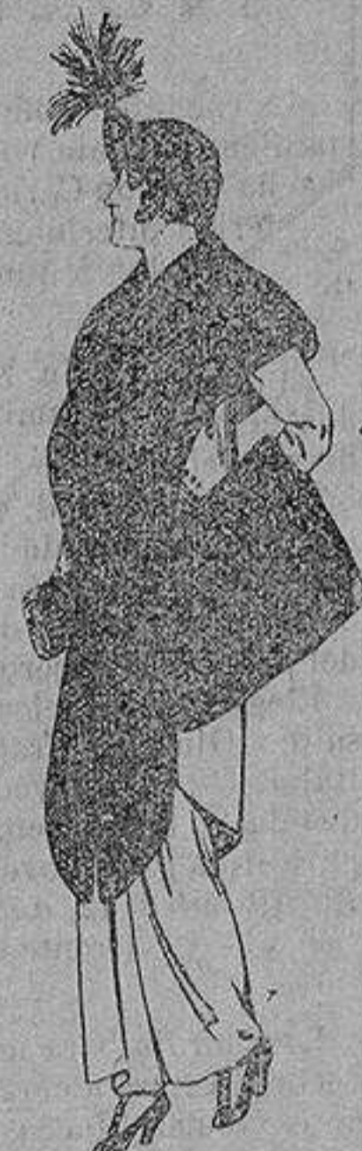
Juego de pieles de loutre de Nord para Señora 145 ptas.