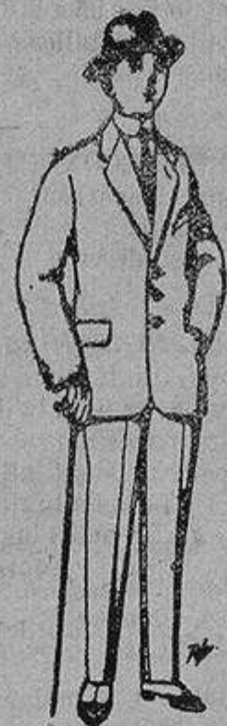
Trajes de paten, vicuña, etc., para niños de 10 a 16 años De 13 a 48 ptas.