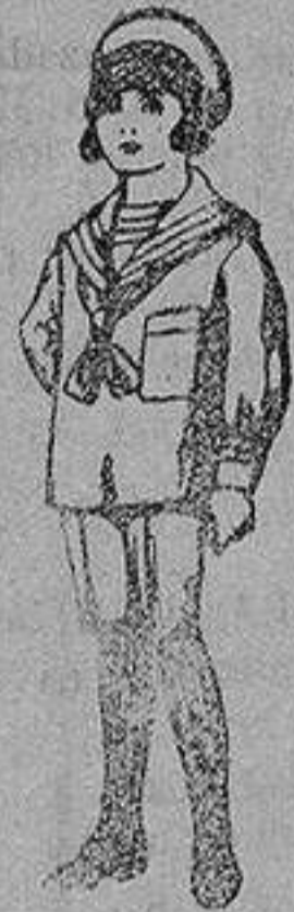
Trajes de jerga azul bordado oro en la manga para niños de 4 a 9 años De 20 a 22 ptas.