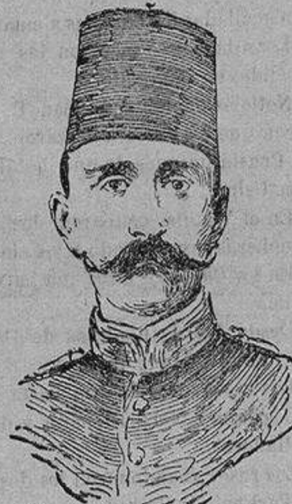
El príncipe Hussein Kemal

Las tropas del general Hindenburg se han visto obligadas a permanecer estacionadas en la orilla izquierda del Vístula.