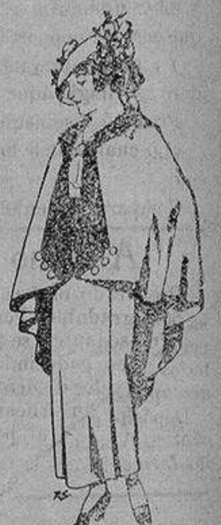
Capas de lana para jovencitas de 13 a 16 años A 25 pesetas

Ropas confeccionadas para Caballero, Señora, Niño y Niña