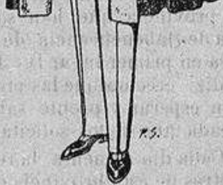
Capas (enteras) de paño De ptas. 35 a 100