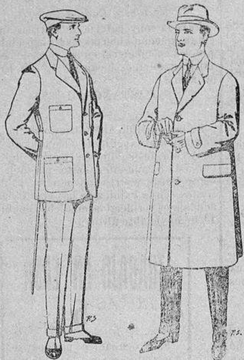
Trajes de cheviot corte elegante para «Sportman» De 35 a 50 ptas.

Peletería, Camisería, Generos de Punto, Corbatería, Guantería, Sombrereria, Zapateria, Paraguas, Bastones y Artículos de Viaje.