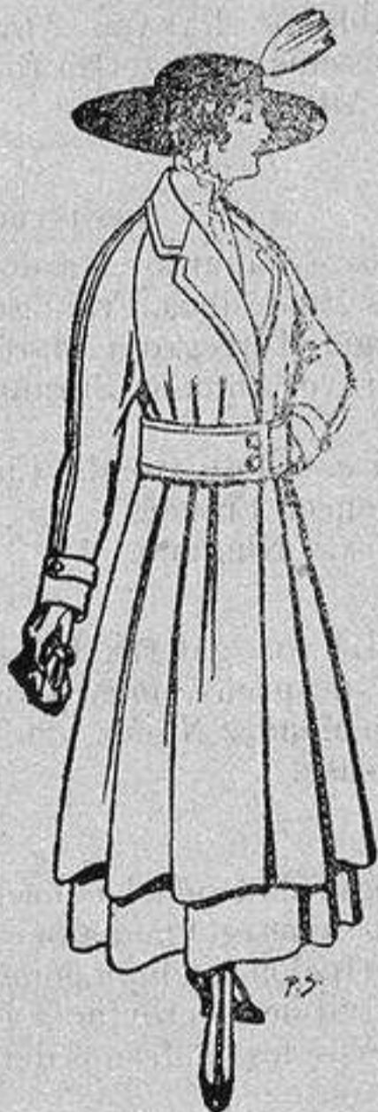
Abrigos de patén gran novedad para señora A ptas. 53