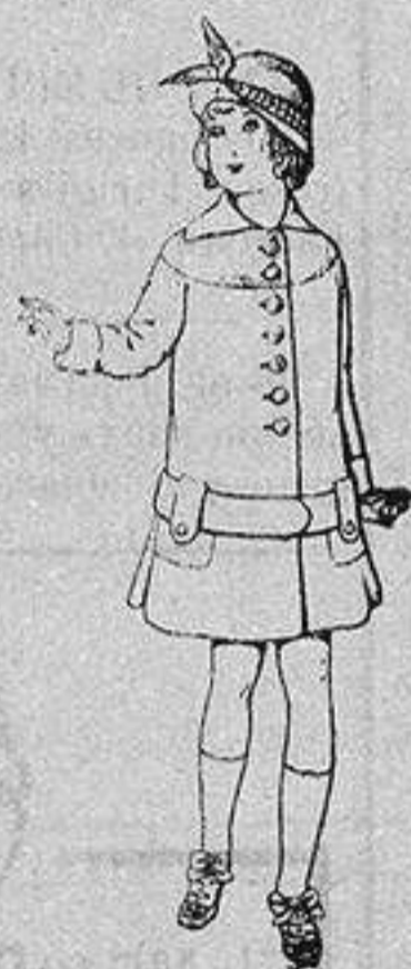
Abrigos de patén para niños de 4 a 12 años De ptas. 15 a 25