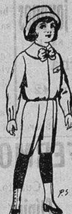
Trajes de patén para niños de 4 a 9 años De ptas. 5 a 7'50