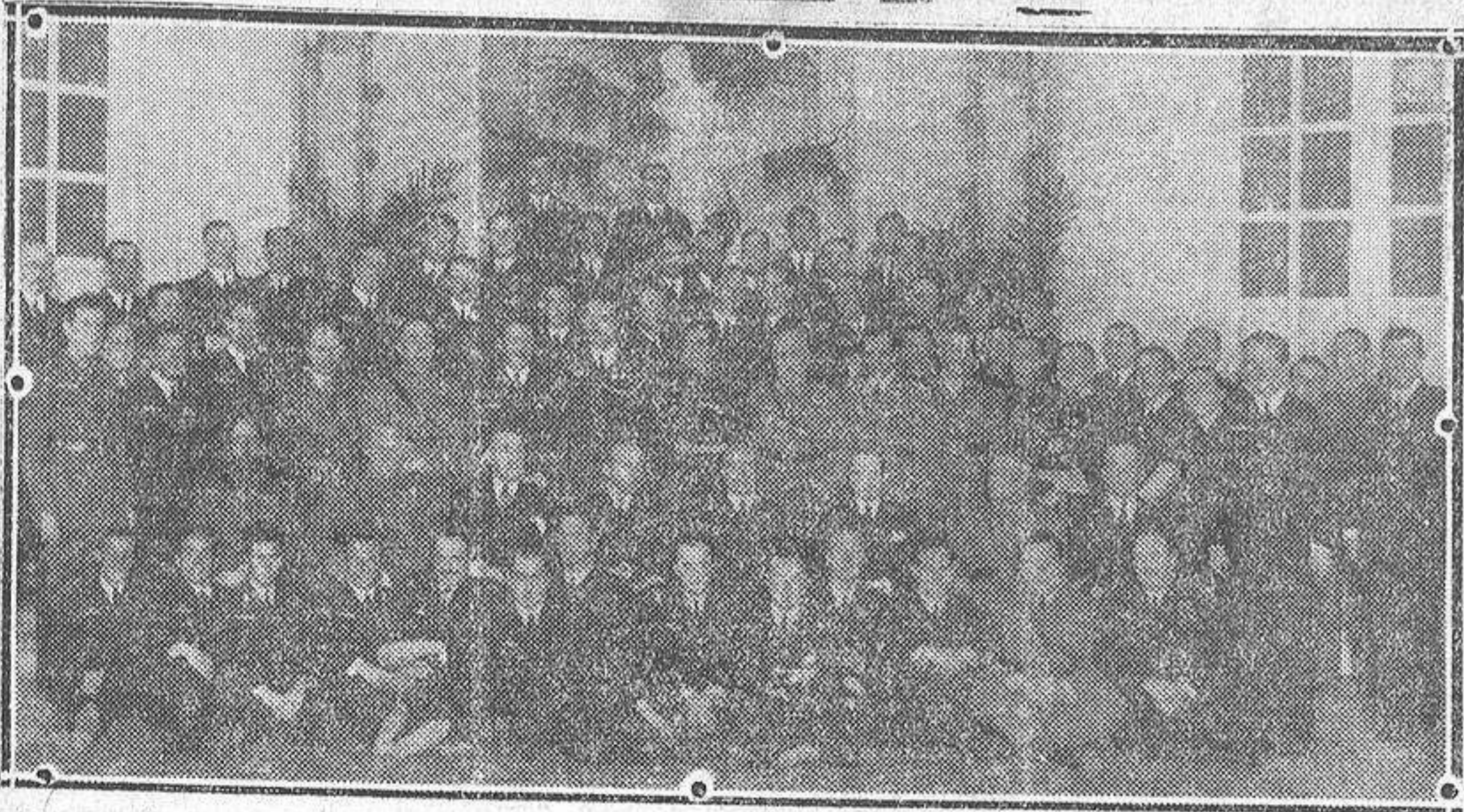
El infante don Alfonso, el jefe del Gobierno, el capitán general de Madrid y el director general de aeronáutica con los concurrentes al almuerzo con que la Aviación española obsequió a los aviadores hispanoamericanos que han terminado sus prácticas en los aeródromos de nuestro país