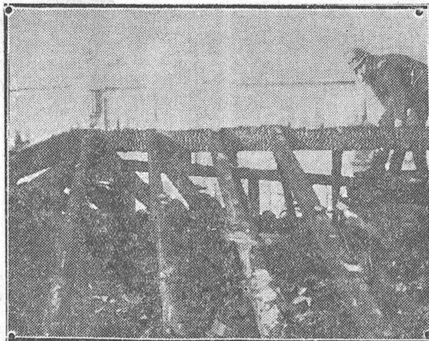
Bomberos trabajando en la extinción del formidable incendio ocurrido ayer en la calle de San Lorenzo de Madrid