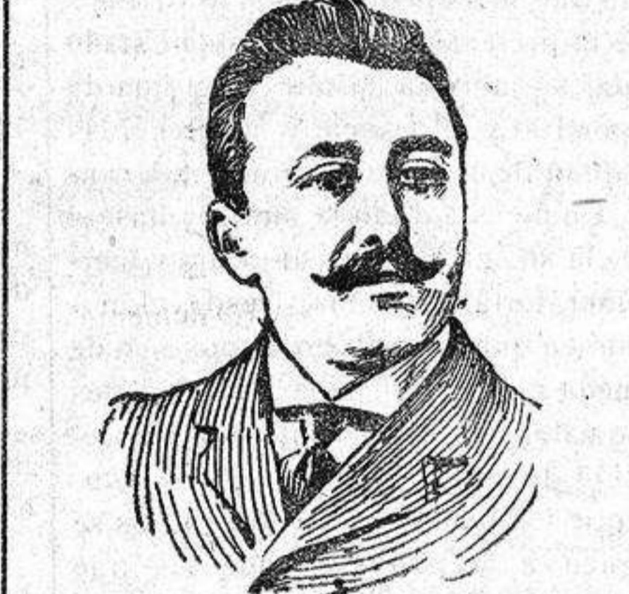
El exministro Sr. Alcalá Zamora que ha sido elegido academico de la de Ciencias Modernas y Politicas