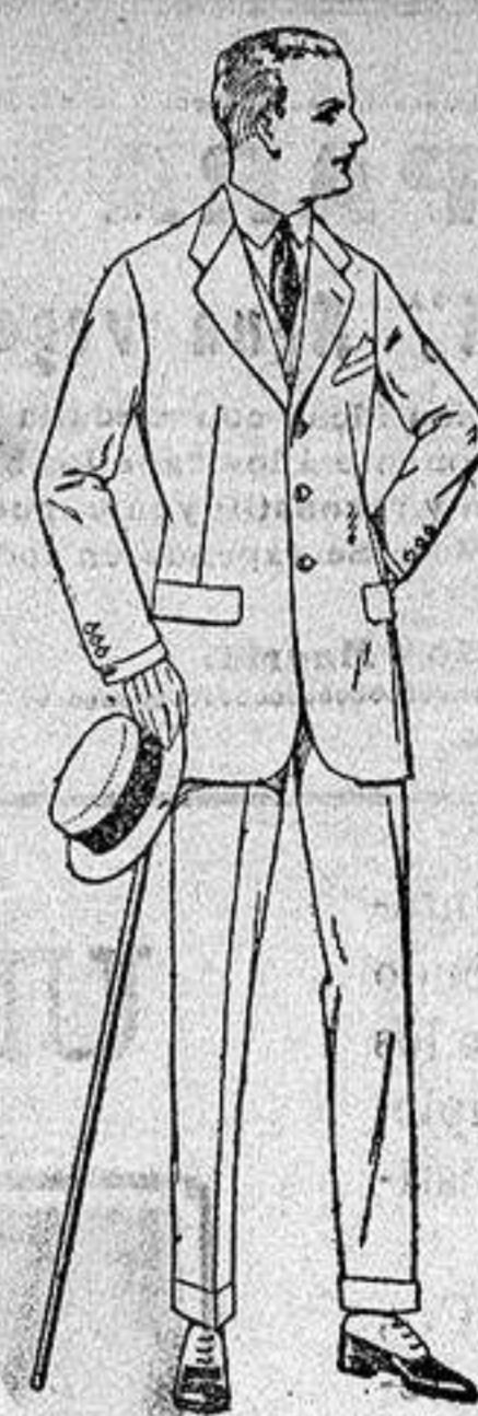
Trajes de lanilla melton, estambre vicuña o jerga, de ptas. 28 a 135 Trajes de dril crudo, kaki o listado Gabanes chevrot, cower melton gabaadina, etc. de ptas 80 a 180 Grandes existencias en géneros para gabanes a medida