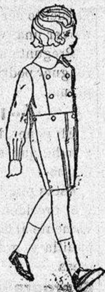
Trajes de vicuña o estambre azul, para niños de 3 a 7 años, de ptas. 25 a 39 Los mismos de dril o hilo de ptas 10 a 15

Ropas confeccionadas para Caballero, Señora Niño y Niña