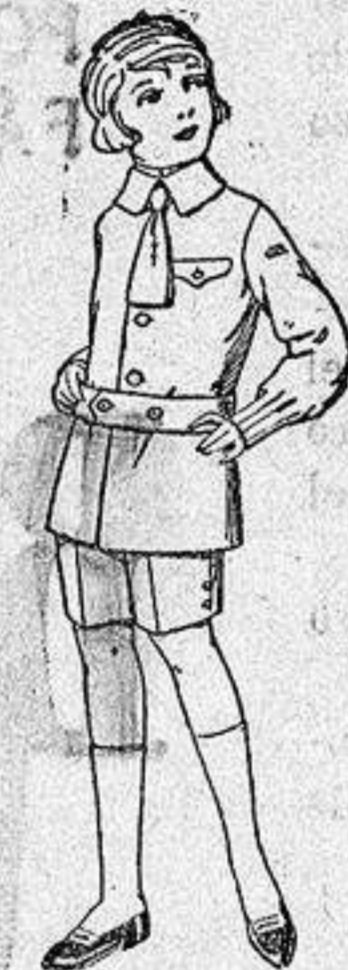
Trajes de lanilla, melton etc. para niños de 4 a 9 años de ptas 15 a 75 Los mismos de dril liso o listado de ptas 11 a 18