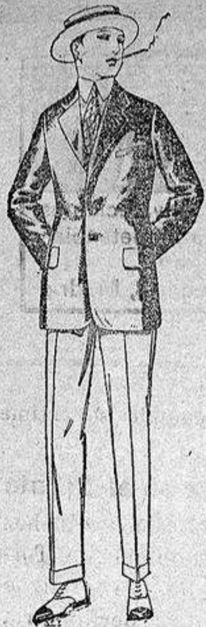
Trajes de alpaca negra o azul de ptas 80 a 115 Americanas de alpaca negra o azul de ptas 40 a 70 Pantalones de dril liso o listado de ptas 10 a 18

Sucursales: Madrid, Barcelona, Almeria, Bilbao, Cadiz, Cartagena, Gijón, Granada, Málaga, Palma de Mallorca, Santander, Sevilla, Valencia, Valladolid, Zaragoza