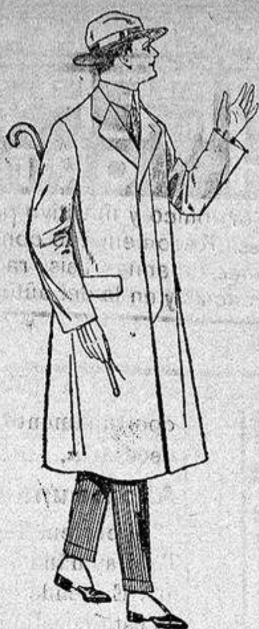
Gabanes de chevrot, melton, etc. con forro seda saten de ptas 60 a 160