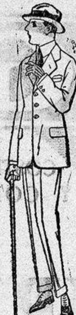
Trajes modelo Sport de lanilla, melton, etc., para jovencitos de 10 a 16 años, de ptas. 27 a 85. El mismo modelo en dril listado, o kaki, de ptas. 25 a 42.