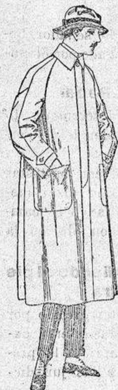
Impermeables franela gavan raglan de pta. 40 a 170. El mismo modelo en cahut choue, negro de psas 70 a 90