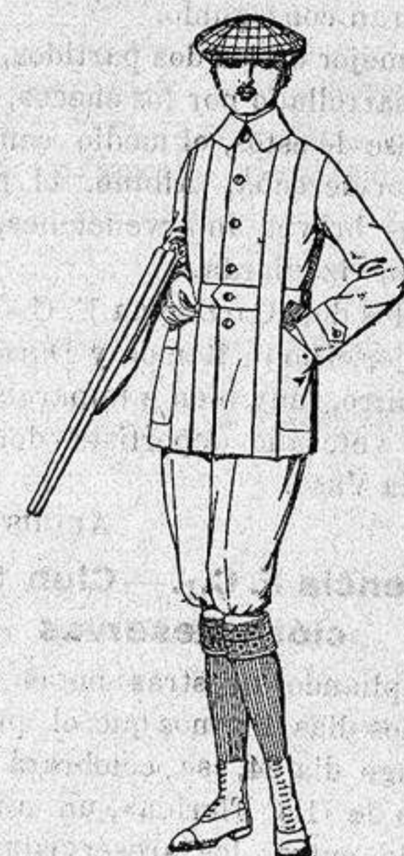
Cazadoras de dril crudo o Kaki de ptas. 25 a 35 Pantalones cortos, para excursionistas, de dril beige o gris de ptas. 1 a 18