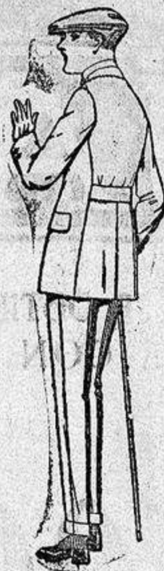
Traje de lanilla, vicuña o estambres para jovencitos de 10 a 16 años, de ptas. 28 a 80 Trajes de dril listado, crudo o kaki, de ptas. 23 a 40