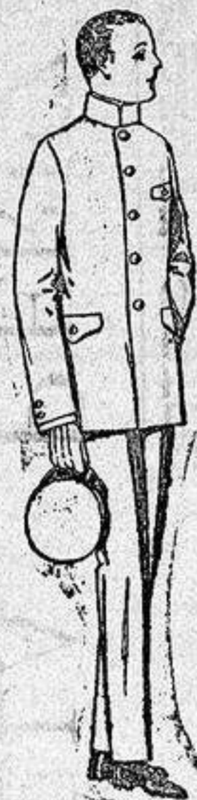
Trajes de vicuña azul o estambre gris para grooms de 10 a 15 años, de ptas 45 a 80. Los mismos con pantalón breches, de ptas. 47 a 80.