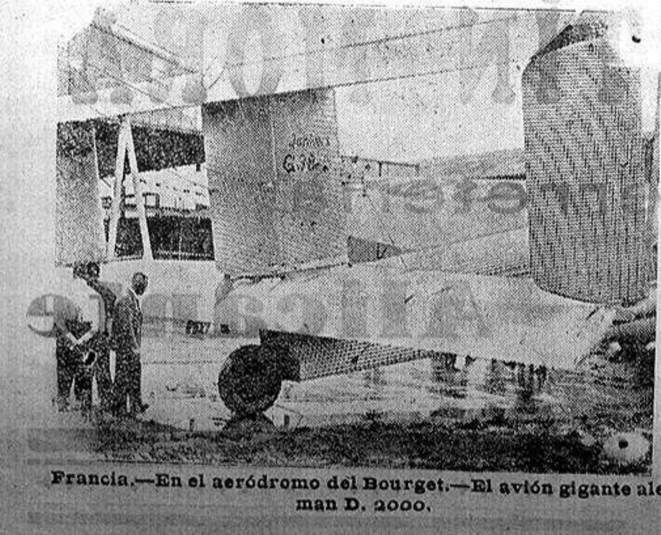
Francia.—En el aeródromo del Bourget.—El avión gigante alemán D. 2000.