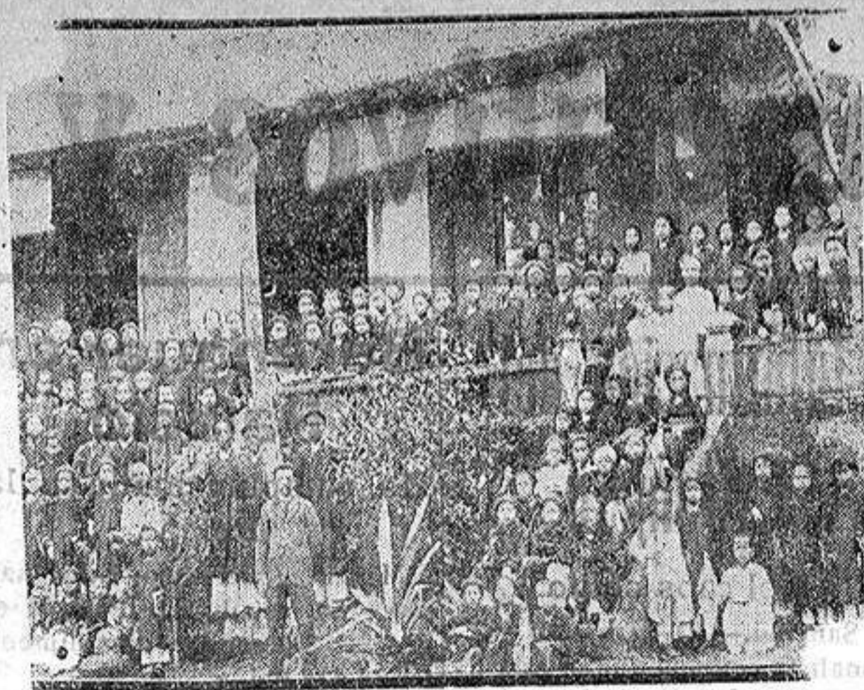
Francia En Indochina.—Una escuela franco-annamita en Yen-Phu