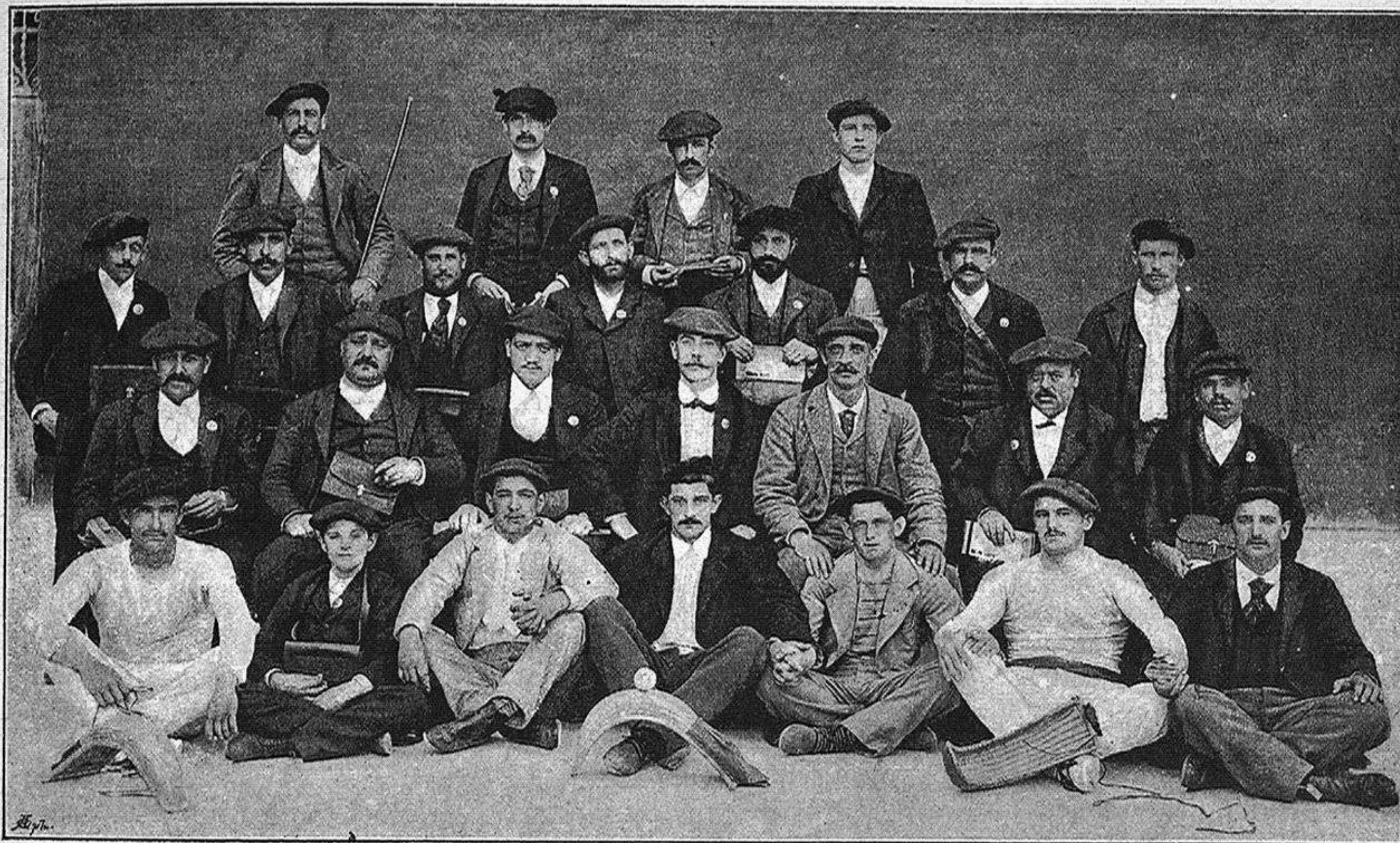
GRUPO DE EXTINGUIDOS CORREDORES

5. a El sacador entregará á los contrarios la