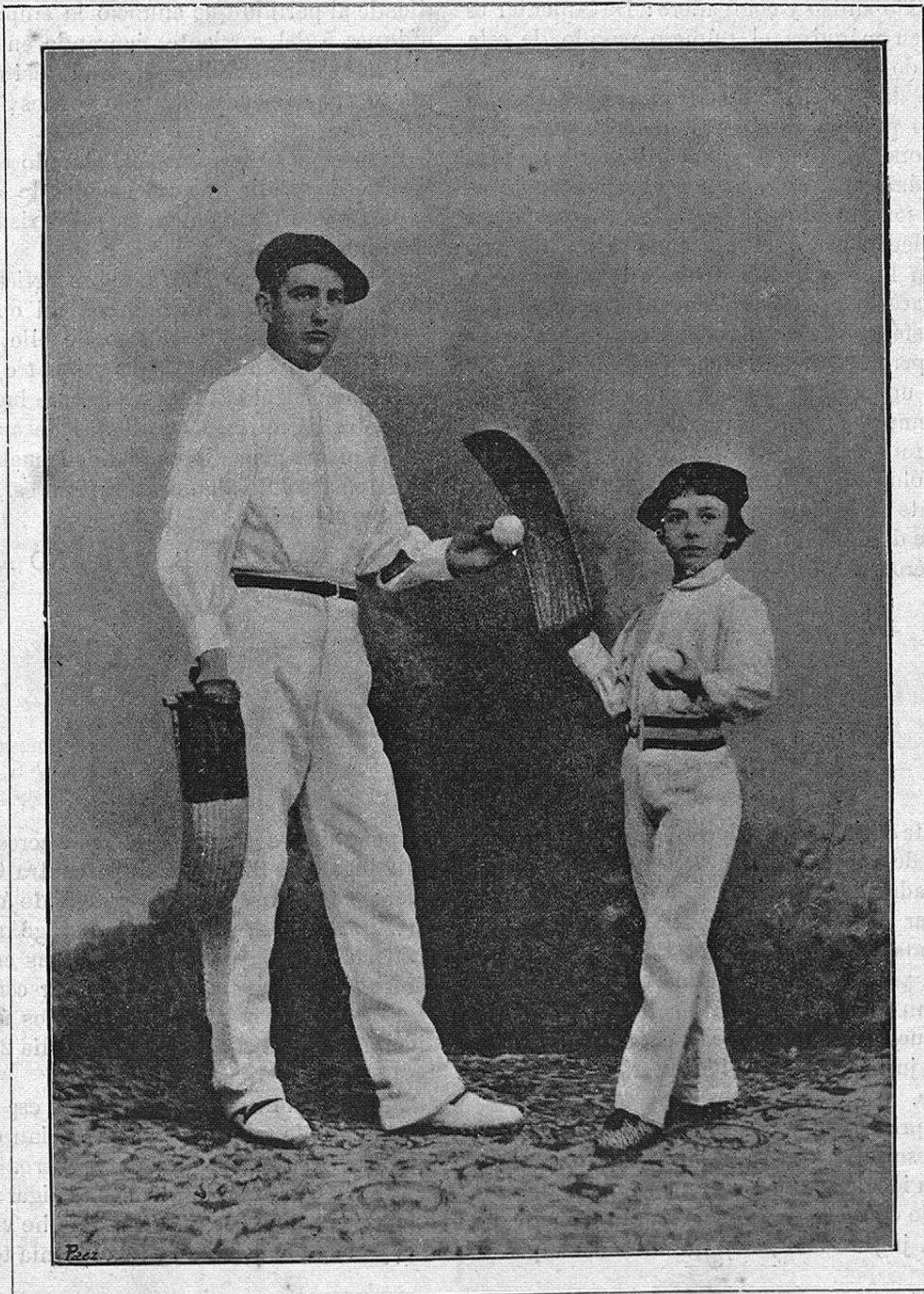
LUIS DE ARAQUISTAIN.