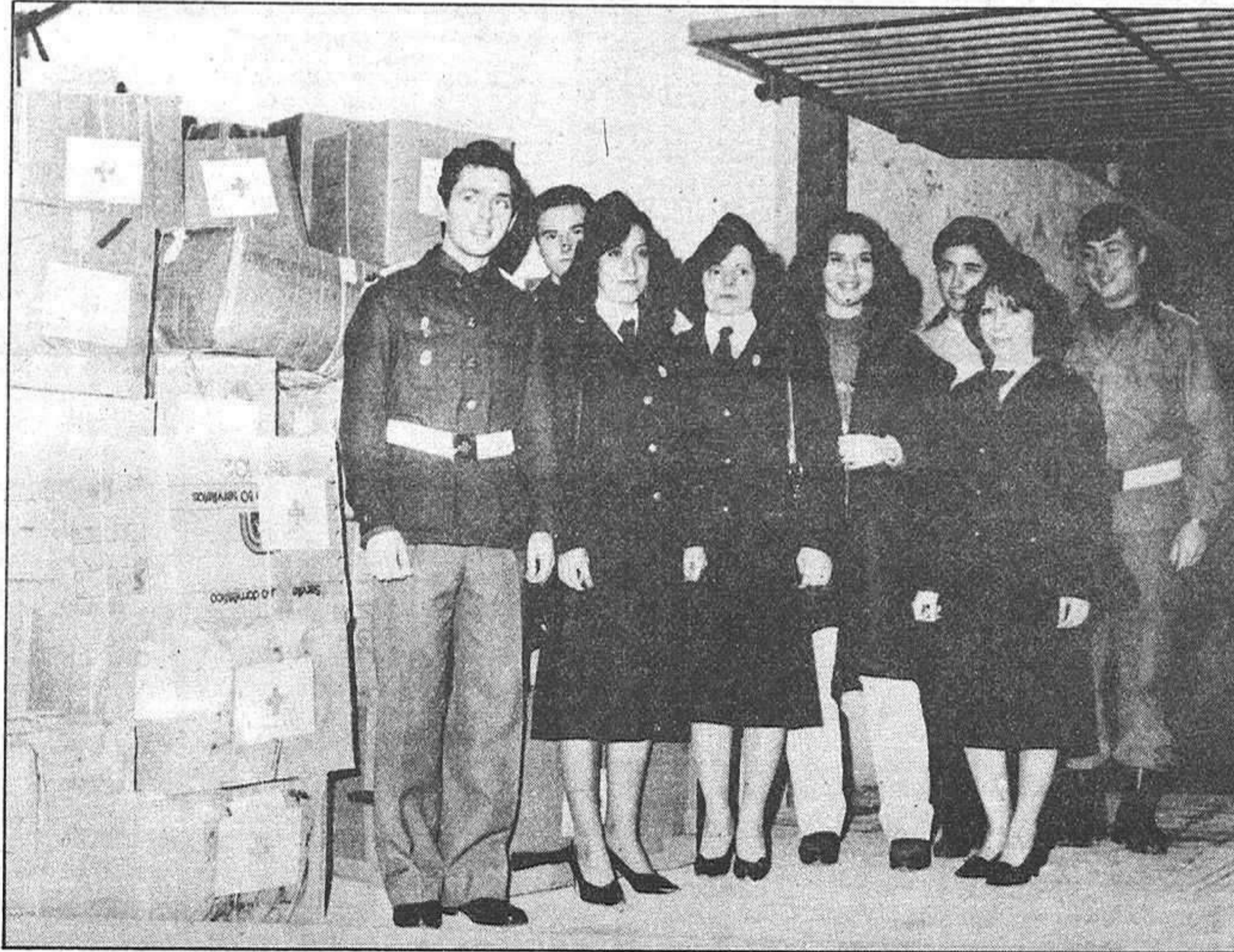
Miembros de la Cruz Roja de Guadalajara, ante una parte de los artículos destinados para Polonia.

Han participado en estas donaciones personas anónimas de Guadalajara, así como de los pueblos de Brihuega, El Casar de Talamanca, Sigüenza y Molina. La Asamblea Provincial nos ha comunicado su agradecimiento hacia estas entidades y personas por las entregas que han realizado. Al margen de