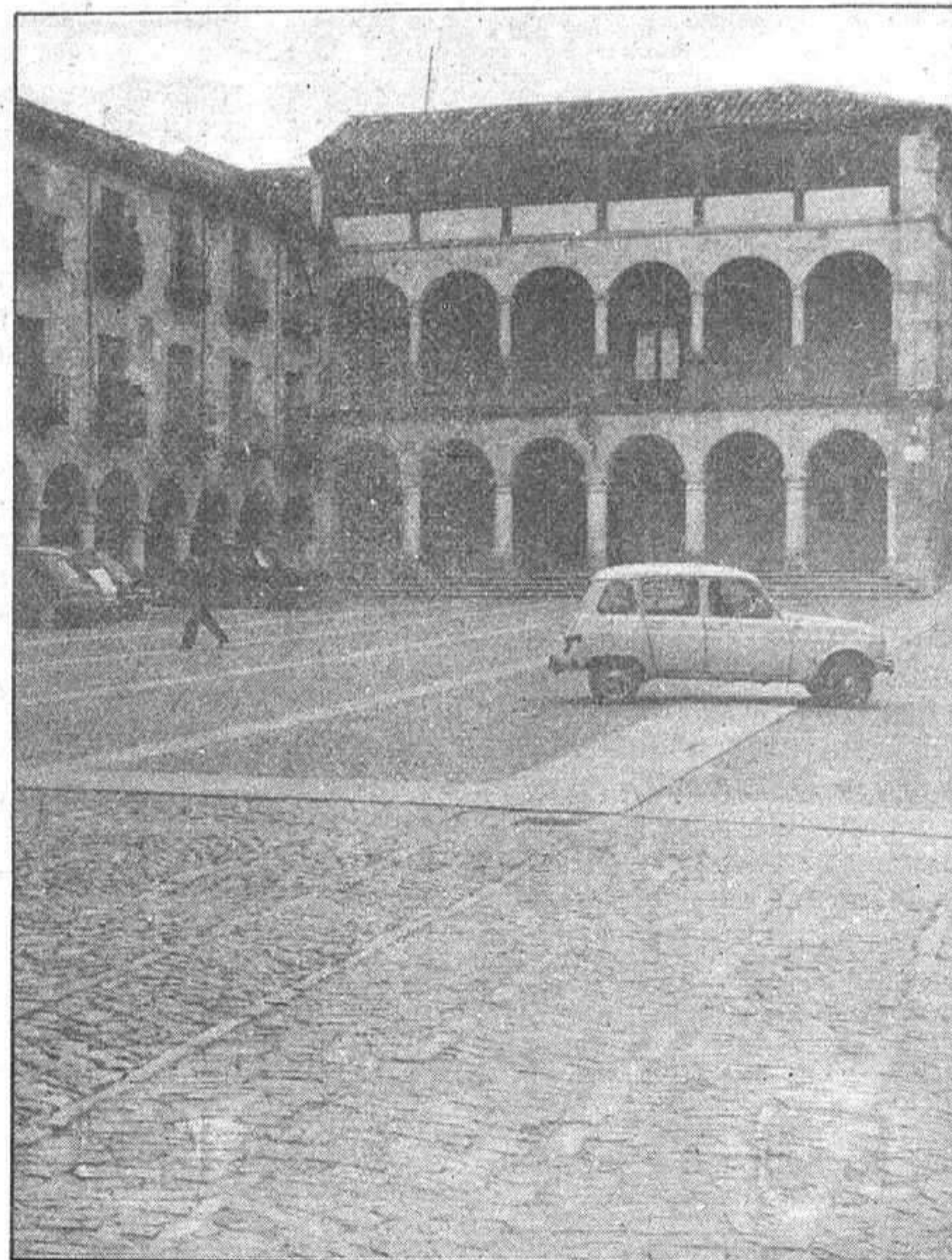
Esta tarde, en el salón de actos del Ayuntamiento, tendrá lugar la entrega de premios del II Certamen Literario.

esta reunión una promesa que ya había hecho al vecindario de explicar cómo está el asunto. Según opiniones recogidas en la ciudad, el tema de fondo que preocupa es el de las bases que serán tenidas en cuenta a la hora de adjudicar las viviendas a los solicitantes. Por otra parte, el retraso que se ha venido produciendo en la construcción de estas cien viviendas ha supuesto una rescisión en la demanda y —seguramente— un aumento considerable en los costes de las mismas.