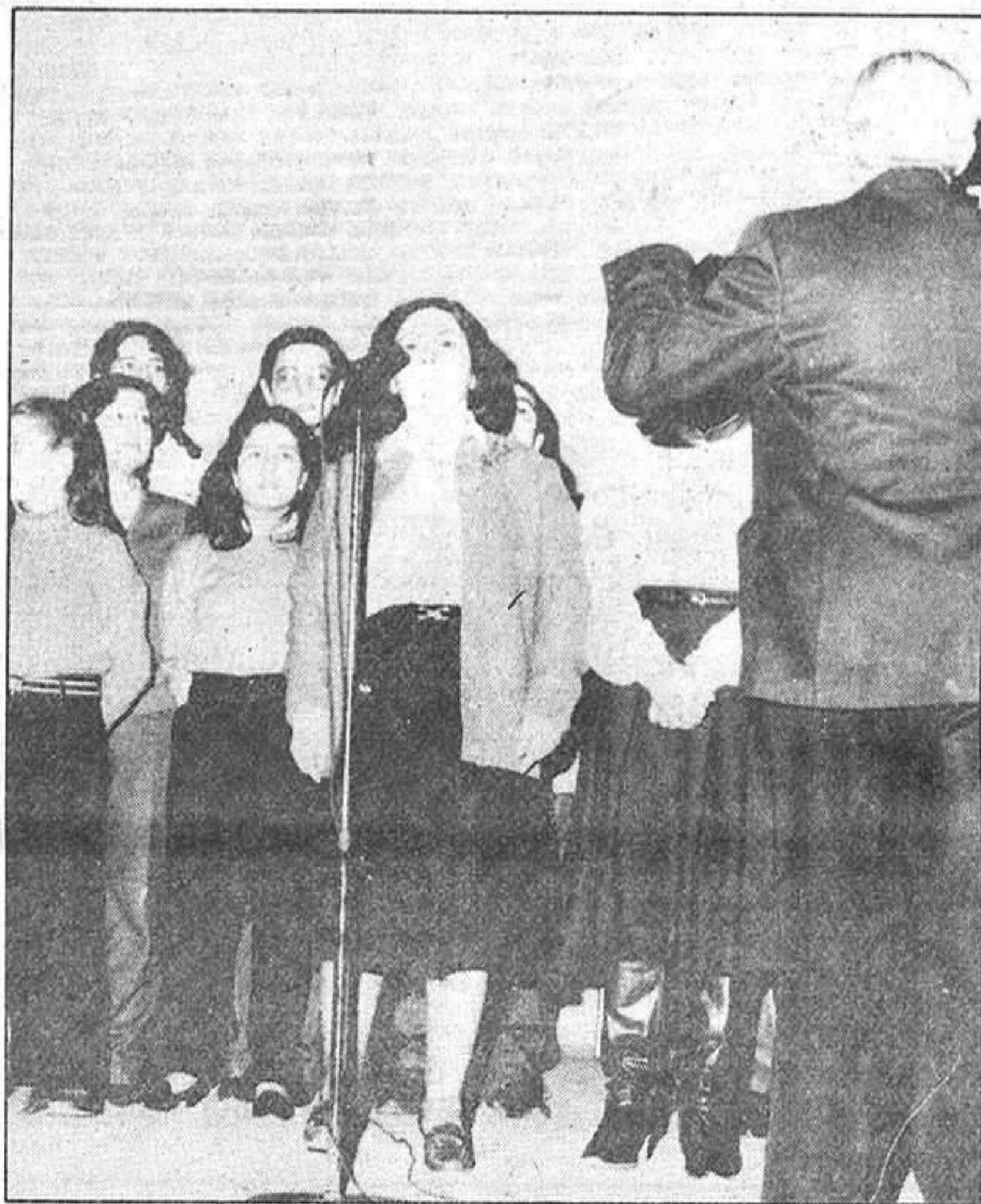
momento de la actuación del grupo de la iglesia parroquial de Santa María de la Peña, ganador absoluto en el concurso de villancicos.

Por lo que respecta a la otra categoría —voces e instrumentos—, hay que reseñar la ausencia del grupo de Cifuentes. Si intervinieron el resto de los galardonados: grupo "Scout", del Colegio Salesiano, "Albanzor", y el grupo de la parroquia de Santa María de la Peña, que demostró con sus canciones la justicia del primer premio obtenido. Es de destacar la heterogénea composición del grupo, desde niñas muy pequeñas hasta hombres adultos. Villancicos como "Está nevando y es de noche" o