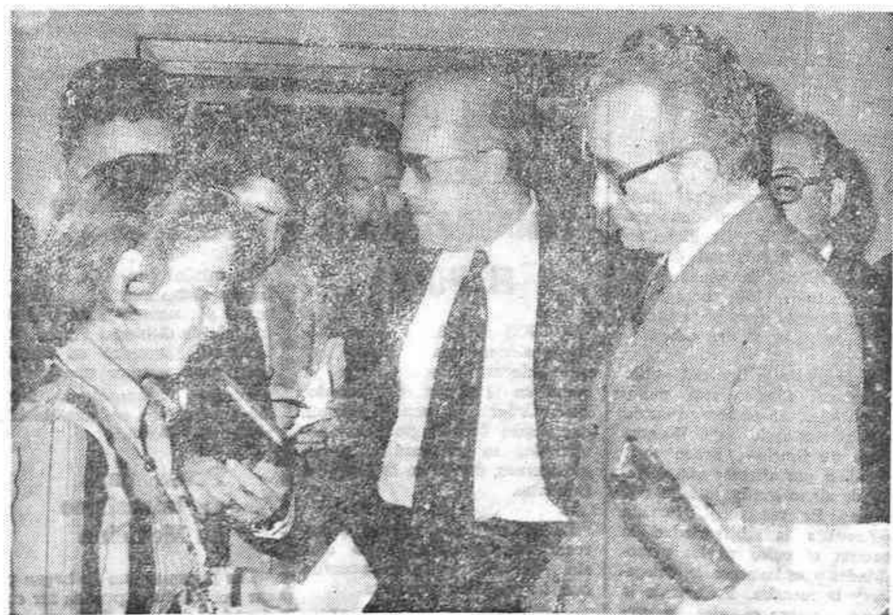
MADRID. — Los ministros de Hacienda y Comercio, señores Cabello de Alba y Cerón Ayuso, respectivamente. Fotografiados en el aeropuerto de Barajas a su llegada procedente de Washington...