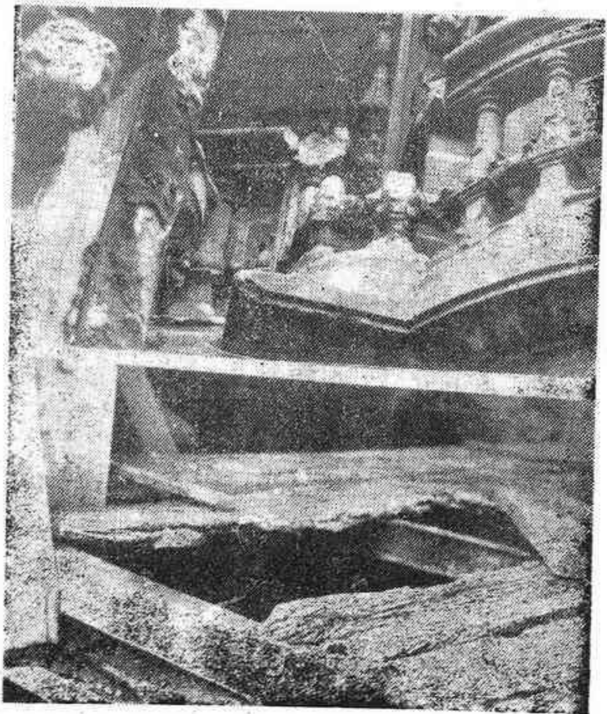
BURGOS. — Como grave ha sido calificada la situación en que se halla la catedral de Burgos debido a los hundimientos y deterioros en las techumbres del templo registrados de un tiempo a esta parte, concretamente al tejado de la capilla de Santa Tecla. — En la composición fotográfica y en la parte superior una vista de los astragos del mal de la piedra en la balustrada y figuras del crucero de la catedral. En la parte inferior, suelo del campanario con sus maderas materialmente podridas.