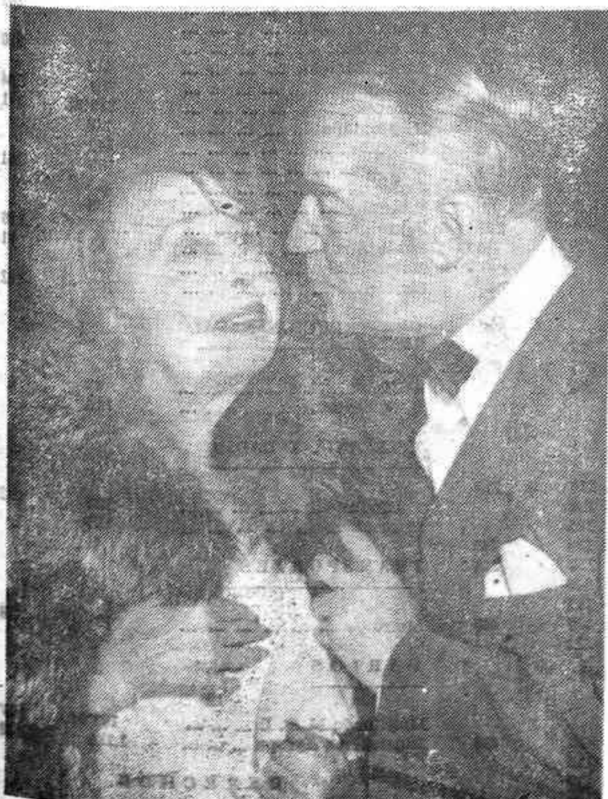
Mistinguette vivió al lado de Chevalier los 10 años más felices de su vida. Cuando el dúo terminó la amistad entre ambos, siguió durante toda la vida...