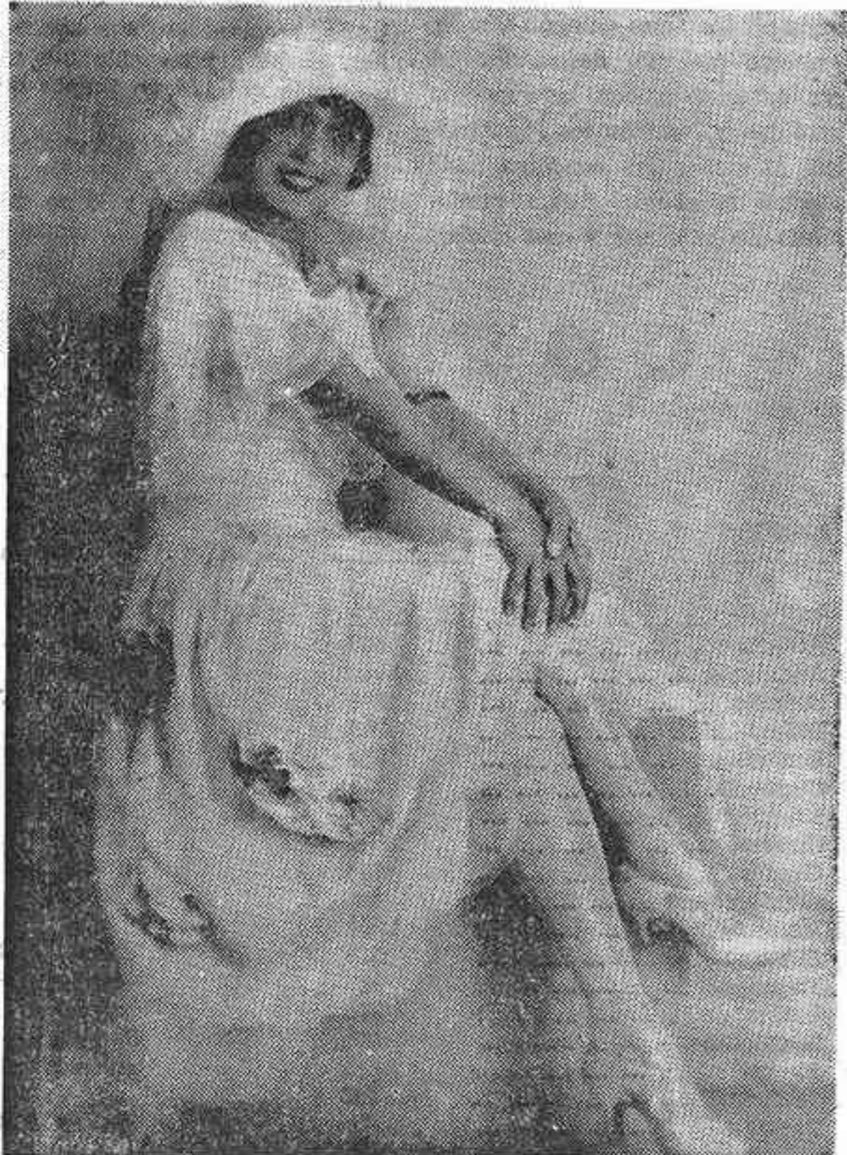
Las famosas piernas de Mistinguette consiguieron traer de cabeza a medio mundo durante dos generaciones