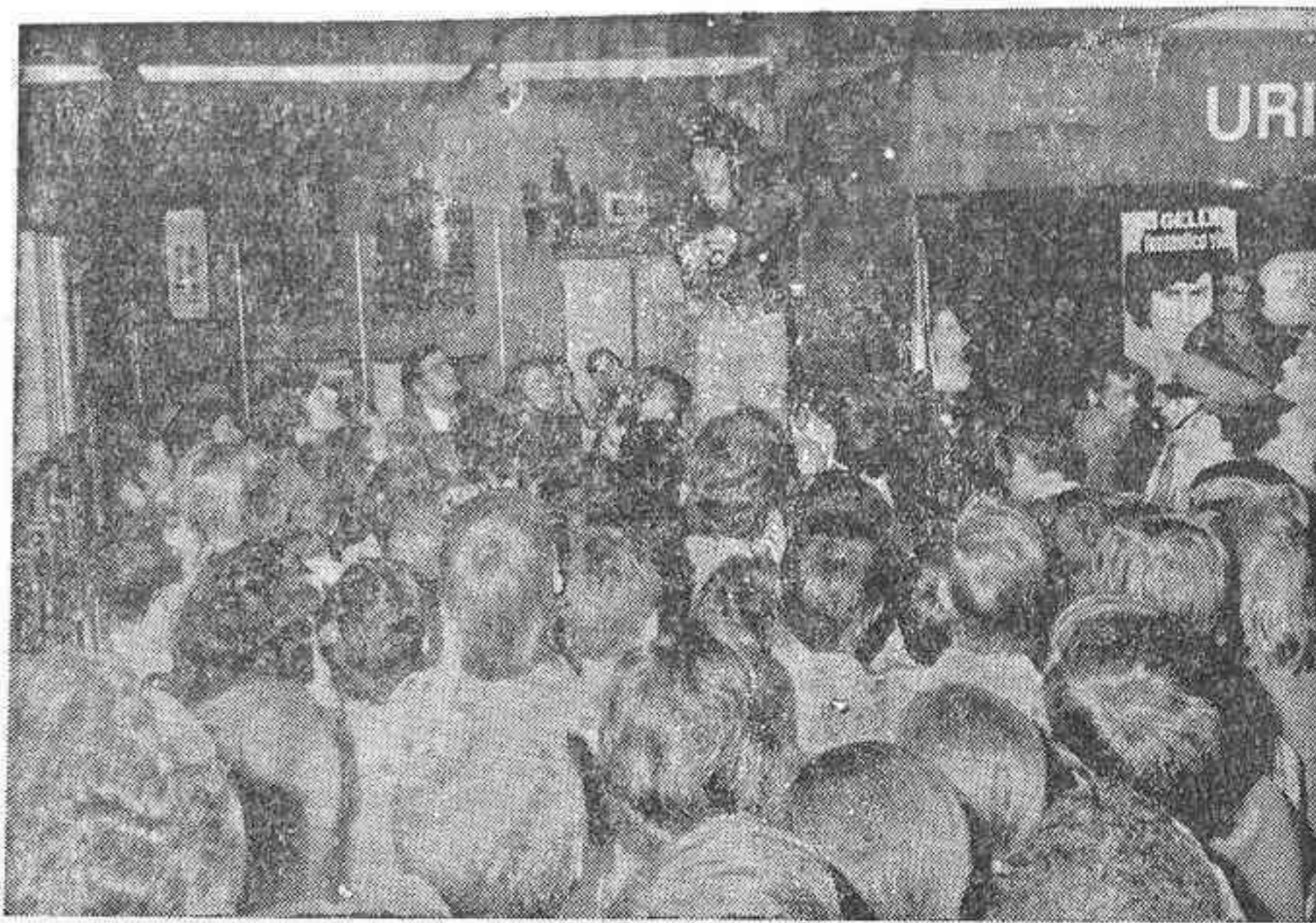
MADRID. — Uri Geller, el joven israelí de 26 años, que con sus demostraciones del pasado sábado en Televisión Española es hoy el centro de los comentarios de todos los españoles...