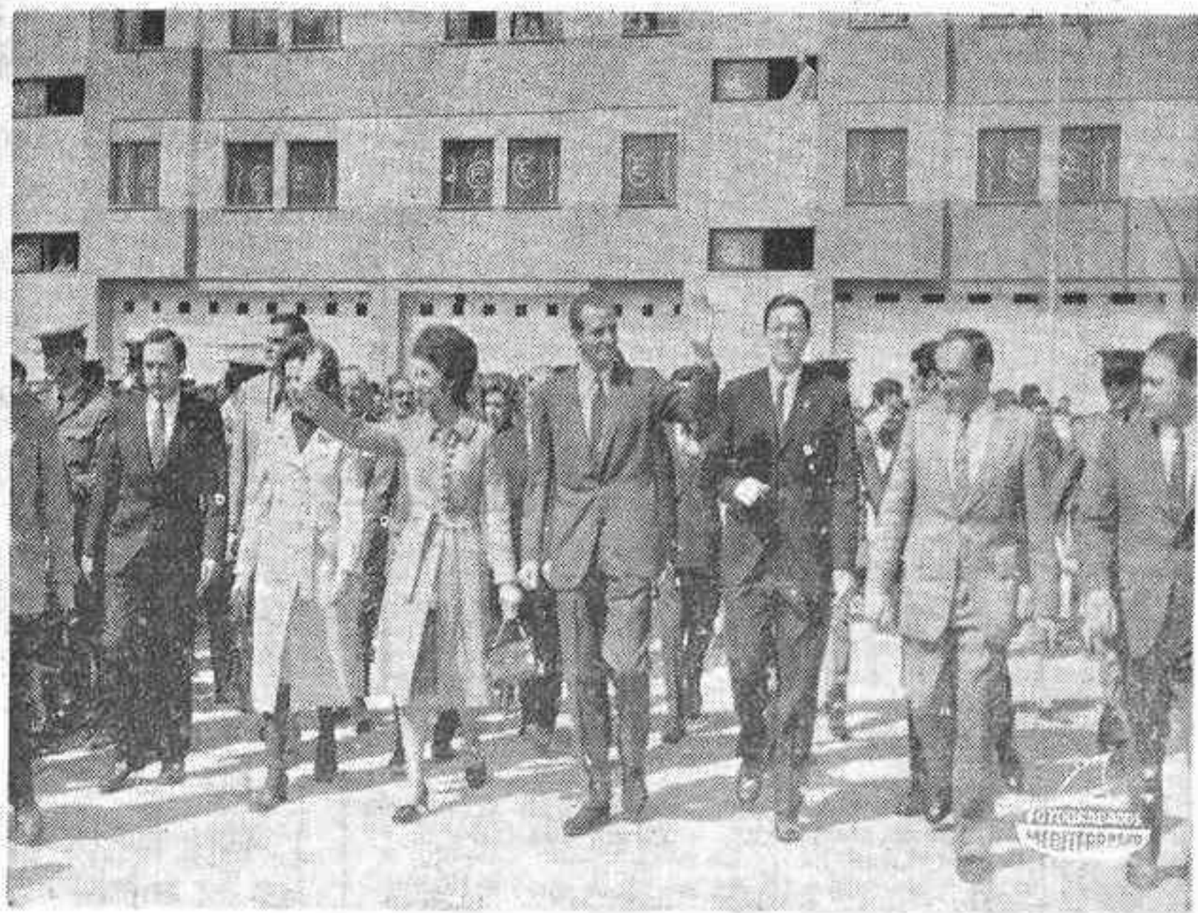
SEVILLA. — Los Príncipes de España D. Juan Carlos de Borbón y su esposa, la Princesa doña Sofía, han continuado sus visitas a la capital andaluza en su segundo día de apretado programa oficial. El Príncipe D. Juan Carlos de Borbón, acompañado del Ministro de la Gobernación, en un momento de su visita al Polígono Sur. El vecindario tributó un cálido recibimiento al Príncipe.

Donde a lo largo de una activa jornada fueron objeto de grandes demostraciones de adhesión y afecto