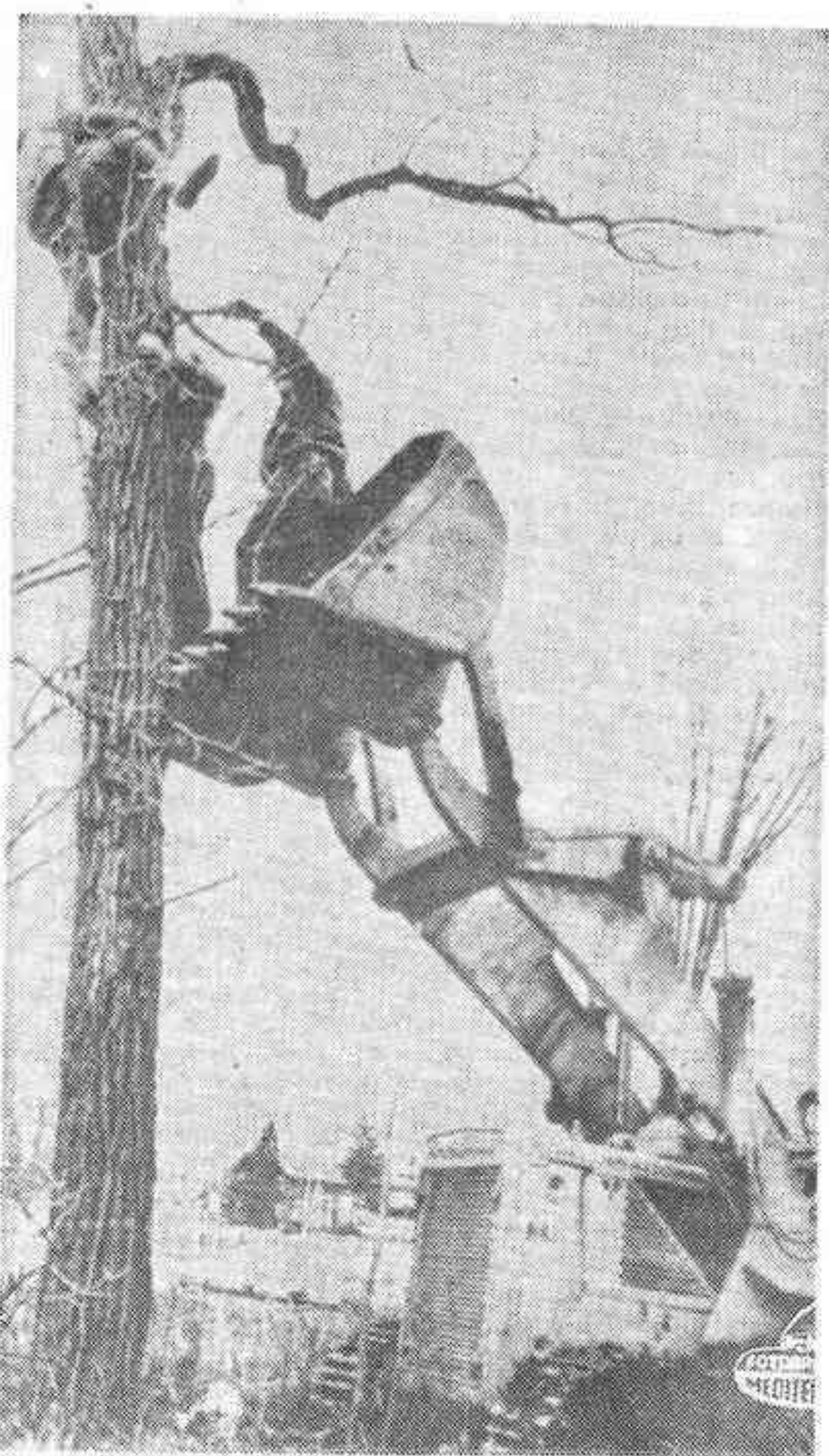
DE KALB (Illinois). — Dos policías, utilizando una excavadora, persiguen a un estudiante de la Universidad de Illinois que como otros compañeros se subieron a las ramas de los árboles para protestar por la utilización de unos bosquecillos para el emplazamiento de un nuevo edificio para Psicología y Matemáticas.

Mientras tanto, continúan en la RAU las medidas preventivas militares. Estos preparativos tienen, de un lado, a poner de manifiesto la gravedad de la situación a las grandes potencias, y de otro lado, pueden acarrear importantes consecuencias en el aspecto interno. Los observadores políticos señalan a este respecto la polémica que ha desatado por primera vez entre Mohamed Hassanin Deykal, Redactor Jefe del diario oficial "Al Ahram" y el periódico "Al Gumbria" órgano de la Unión Socialista Árabe (partido único de Egipto), sobre las posibilidades y dificultades de una solución militar en el Cercano Oriente. Este enfrentamiento sin precedentes en la prensa árabe evidencia las profundas divergencias surgidas entre "palomas" y "halcones" de la RAU, divergencias que se han agravado aún más tras el fracaso el mes pasado de la ofensiva de paz egipcia para reanudar la misión Jarring.