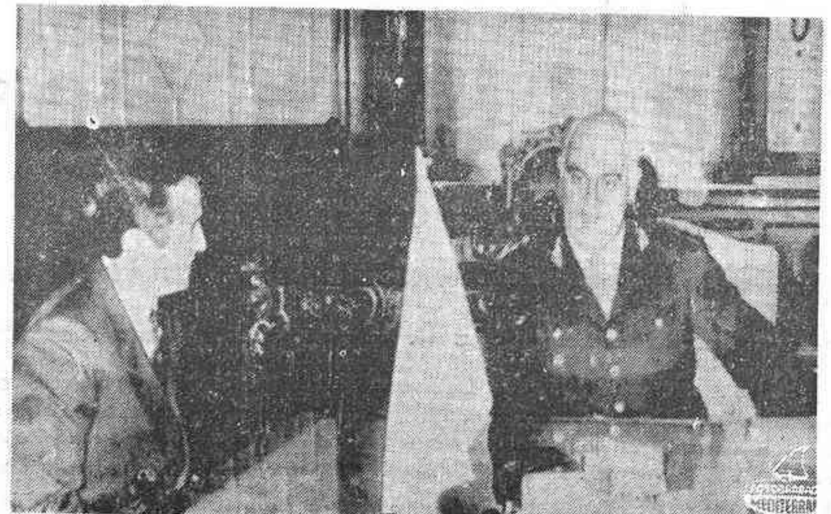
BUENOS AIRES. — El Ministro español de Asuntos Exteriores, Gregorio López Bravo, durante la entrevista mantenida en la Casa del Gobierno, con el presidente de la Junta de Comandantes, General Alejandro Lanusse.