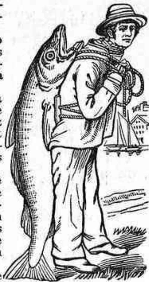
MARCA DE FABRICA

La Emulsión Scott es el remedio soberano para los resfriados, la tos, la bronquitis, las afecciones de la garganta y de los pulmones; la debilidad general, la clorosis y la anemia, el linfatismo, la escrófula, el raquitismo y demás enfermedades de desgaste de fuerzas, ya sea en niños ó en adultos.