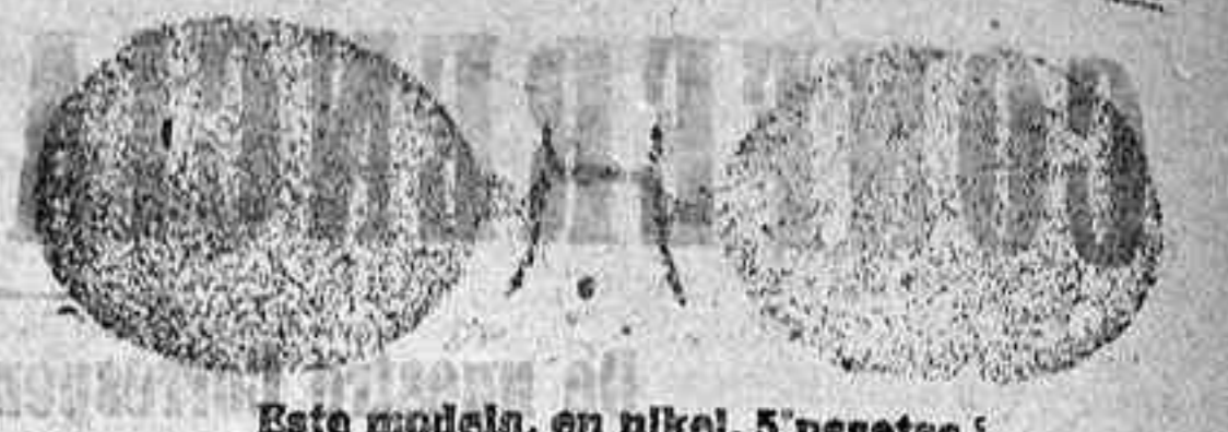
Este modelo, en níquel, 5 pesetas.

Gran Relojería y Óptica de Antonio Ferreira Plaza Mayor, 40 (acera de Correos), Salamanca. Gran surtido en relojes finos y corrientes, en ORO, DE SENORA Y CABALLERO; relojes de plata, acero y níquel, marcas escogidas; despertadores de bolsillo con esferas Radio. RELOJ ORO DE LEY, en cerrea, para caballero o señora, 40 pesetas; en níquel, 7. Inmenso surtido en toda clase de Gafas o Lentes, en oro, oro chapeado, níquel y concha; GAFAS O LENTE, oro chapeado, clase garantizada, con cristales graduados, a 12 pesetas; en níquel, 5. ESTUCHE PIEL, AMERICANO, 1,25 en relación de precio con los restantes. Se despachan recetas de los señores oculistas. Primera Osa para instalaciones de Relojes de torre, dando grandes facilidades para los pagos.