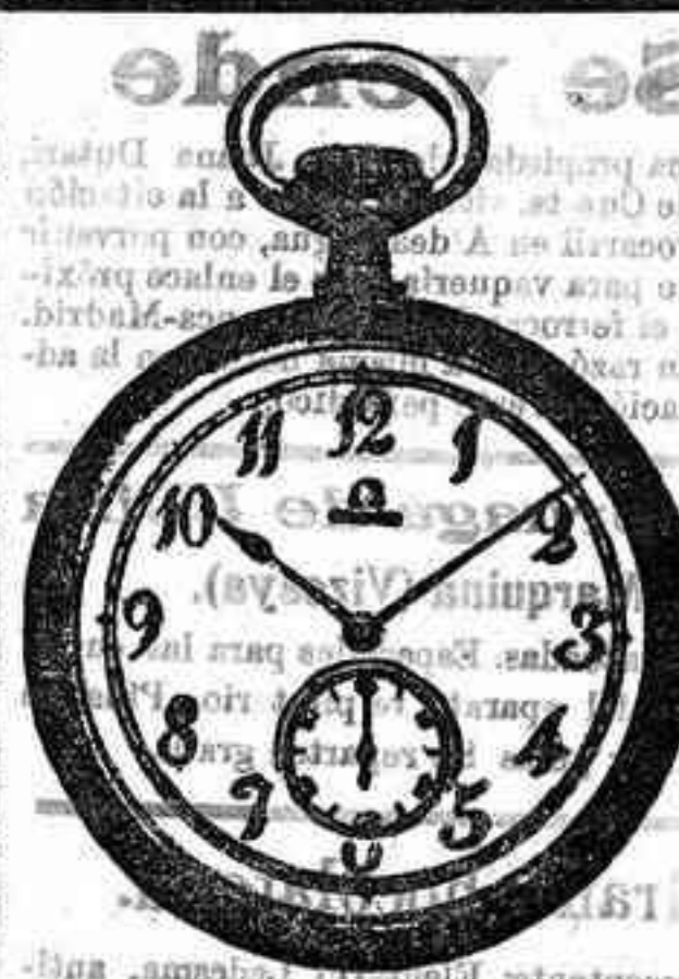
OMEGA LEGITIMO a 27 Pesetas

P. Mayor, 40 (acera de Correos) SALAMANCA. SECCION DE RELOJERIA Esta casa tiene demostrado, y ninguna otra puede dar las ventajas en todos sus artículos, ochenta modelos de relojes de oro de caballero y señora, en repeticiones, Cronómetros, Cronógrafos y otros en marcas «Omega», «Juvania», «Langines», «Ancoras» de precisión de varias marcas. Relojes corrientes en plata, acero, níquel y fantasía en marcas «Omega», «Long», «Waltan» e ininidad de clases y marcas. Relojes pulseras en oro, plata y chapado. Relojes de pared, estilo inglés, ruble, nogal y caoba; modelos exclusivos en carrillón o cuartos y corrientes. Despertadores, sobre mesa y corrientes. Despertadores gran fantasía. Medallas y cadenas.