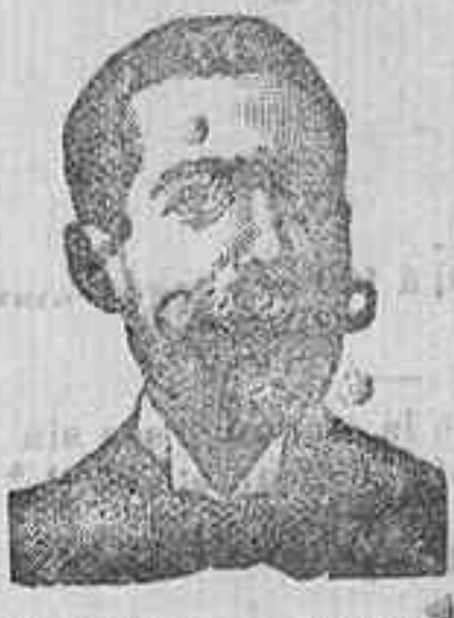
A. SALYATI COSTANZI Diputación, 435, Barcel.

Preparación la más racional para curar la tuberculosis, catarros crónicos, bronquitis, infecciones, gripas, enfermedades convulsivas, inapetencia, debilidad general, postración nerviosa, y afección, impotencia, enfermedades mentales, caries, raquitismo, escorbuto, etc. FARMACIA DEL DR. BENEDICTO, SAN BERNARDO, 41, MADRID y en la provincia de Salamanca, farmacia del Ldo. Rodilo, Guijuelo.