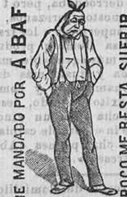
HE MANDADO POR AIBAF POCO ME RESTA SUFRIR