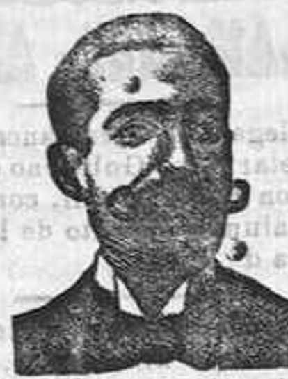
A. SALVATI COSTANZI Diputación, 435, Barcel.