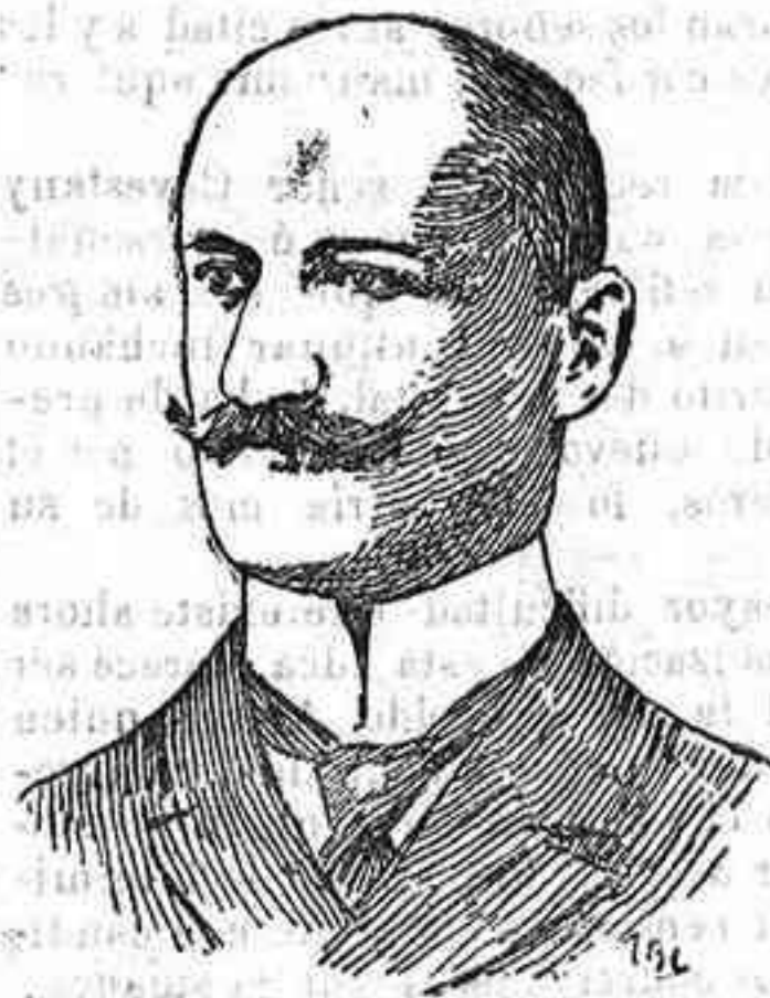
Mr. Golovine segundo presidente de la Duma

Solo en cada distrito para un rato; viene, se vá, retorna, y huye al fin. ¿Es esto un candidato? Ya veis que más parece un andarín.