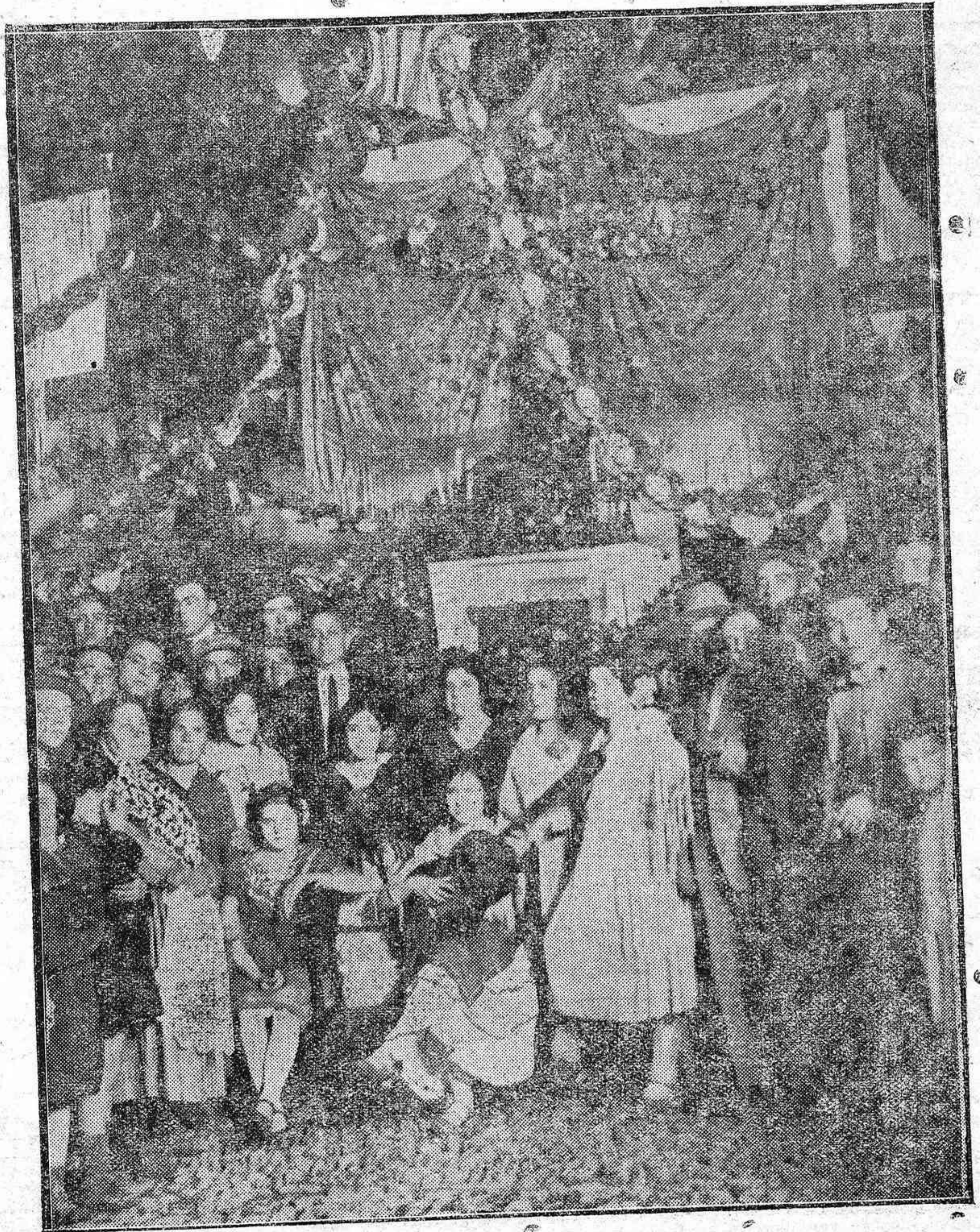
LAS CRUCES DE MAYO. -Típica y artística cruz de flores naturales, instalada en la calle del Buen Pastor 17, que llama poderosamente la atención.