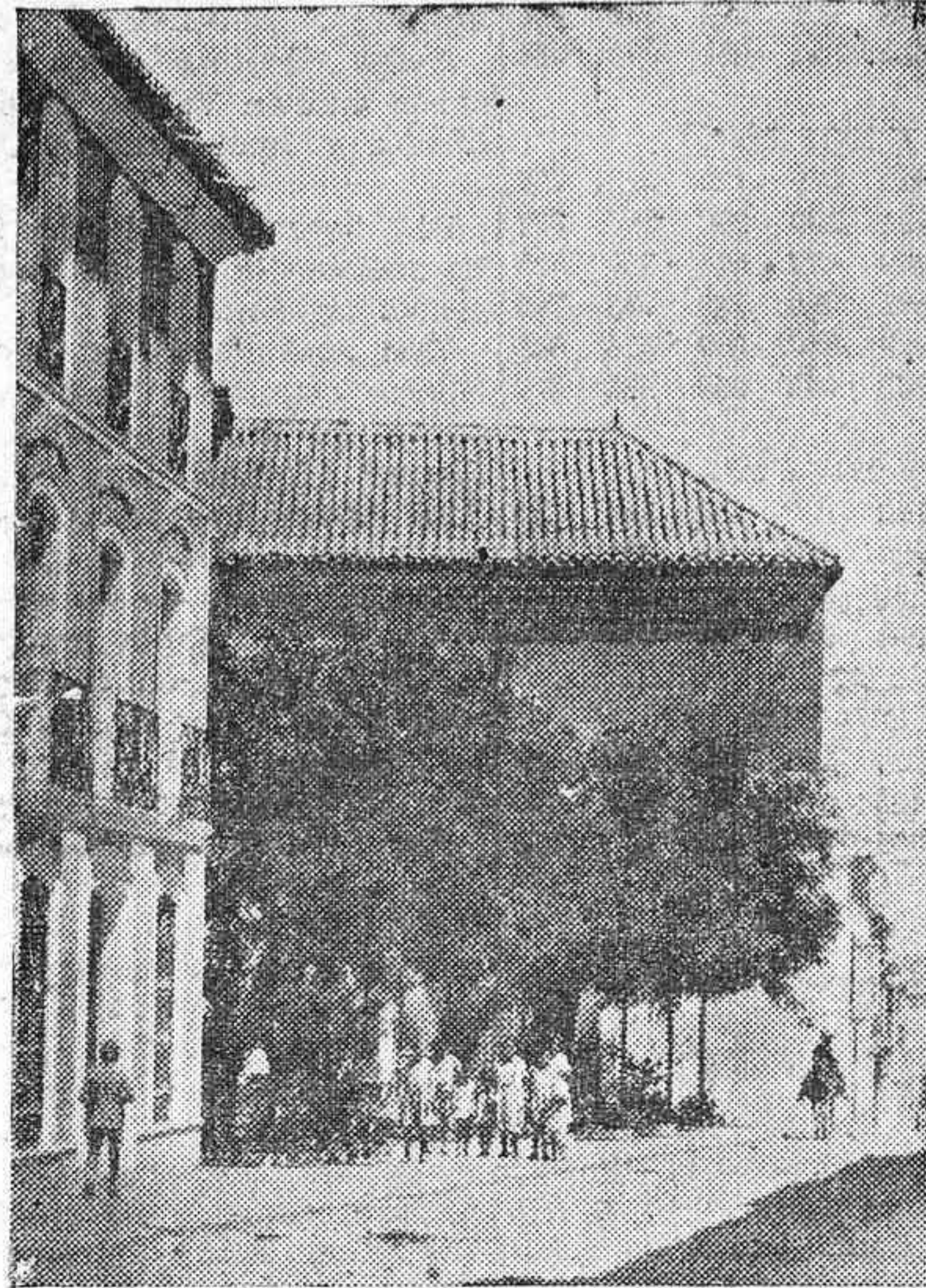
AGUILAR.—PINTORESCO RINCÓN DE LAS CARMELITAS DESCALZAS.

OPORTUNIDAD: ropa hecha para hombre a precios increíbles de baratos, en El Metro y su Sucursal de calle Concepción número 30.