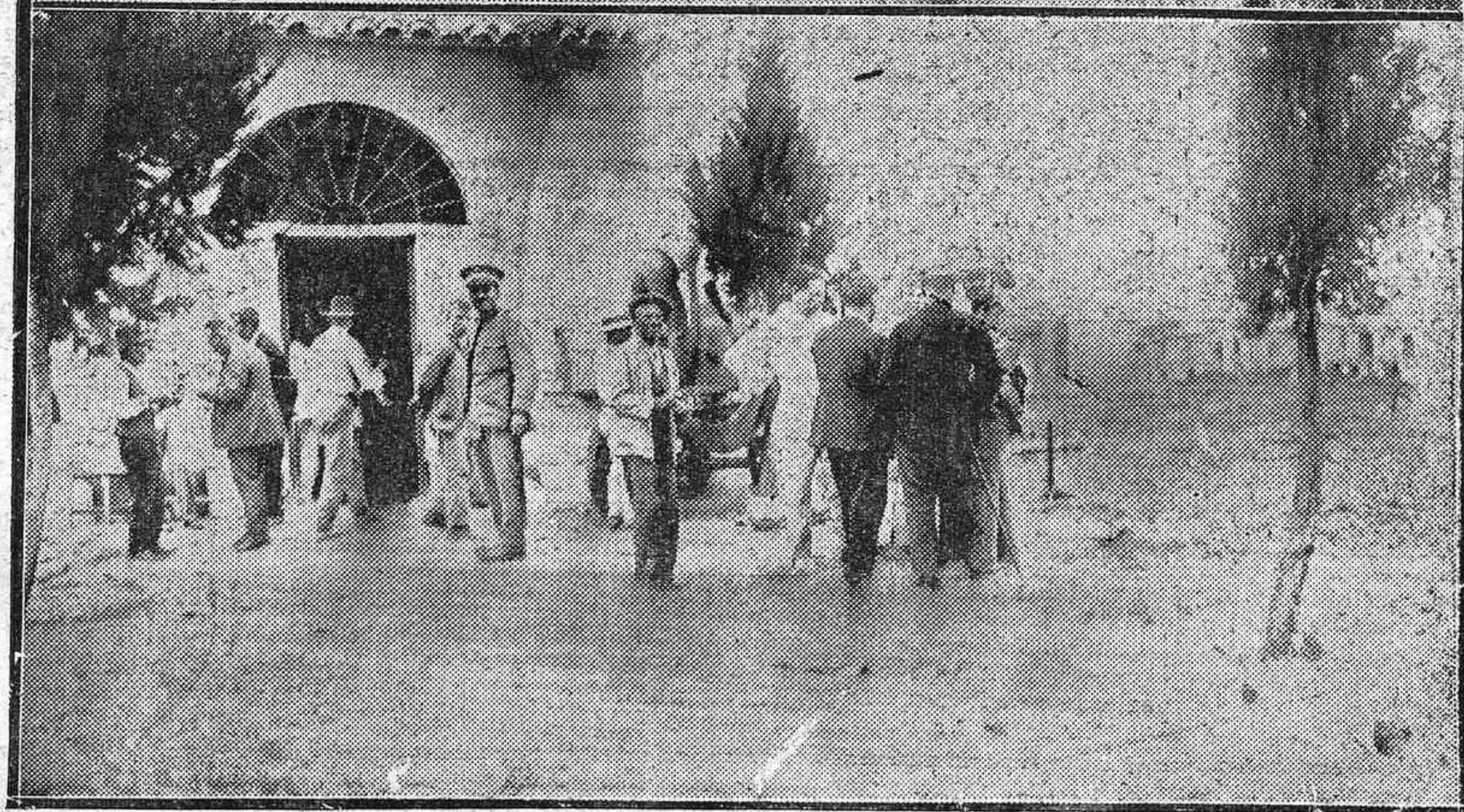
DE LA CATÁSTROFE DE AYER EN LA CUESTA DE LAS CUMBRES.—Dos notas gráficas, en las que puede observarse el lugar donde ocurrió el siniestro, y el momento de conducir al cementerio de Villafranca los restos informes de las víctimas.