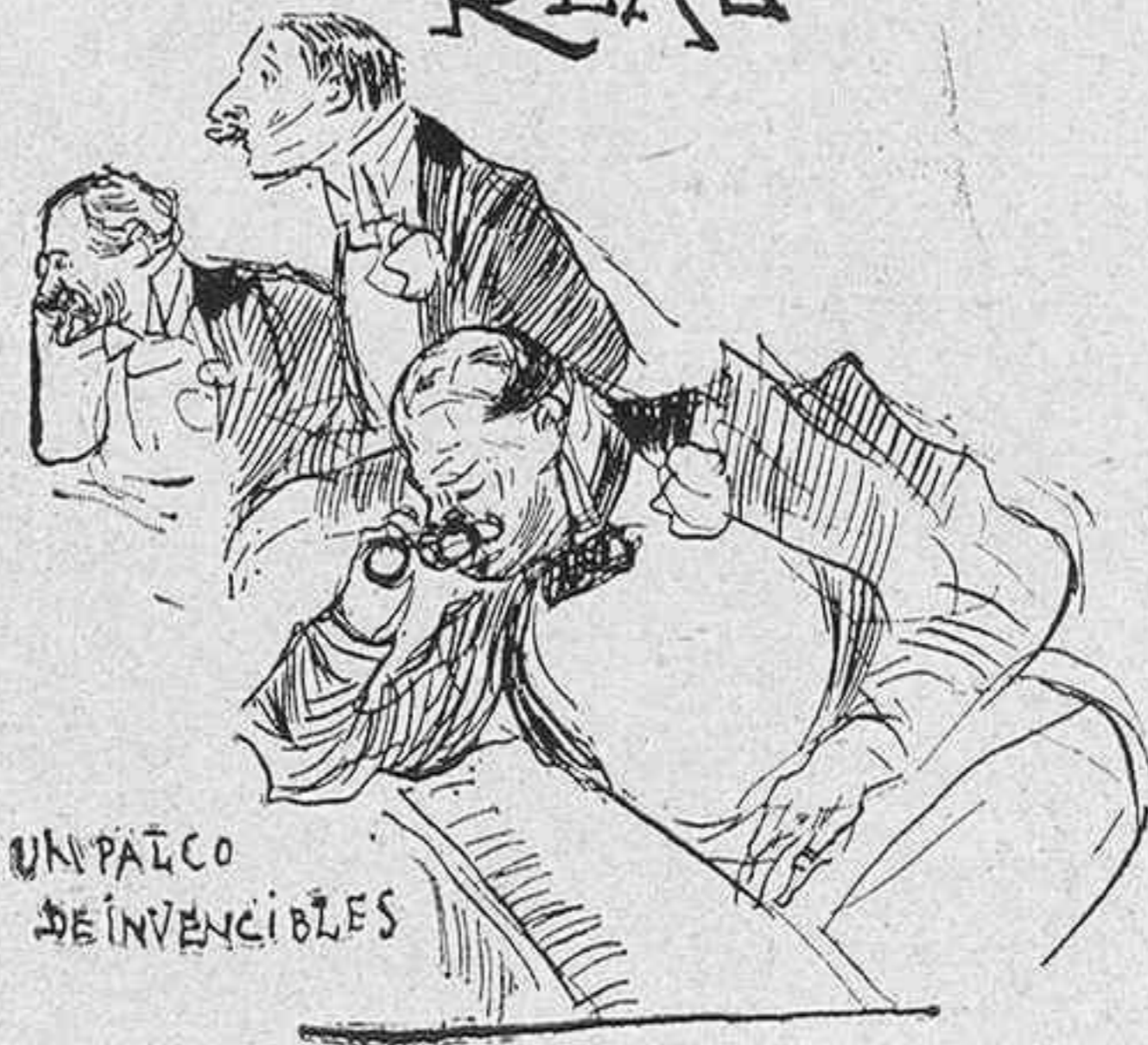
UN PALCO DE INVENCIBLES