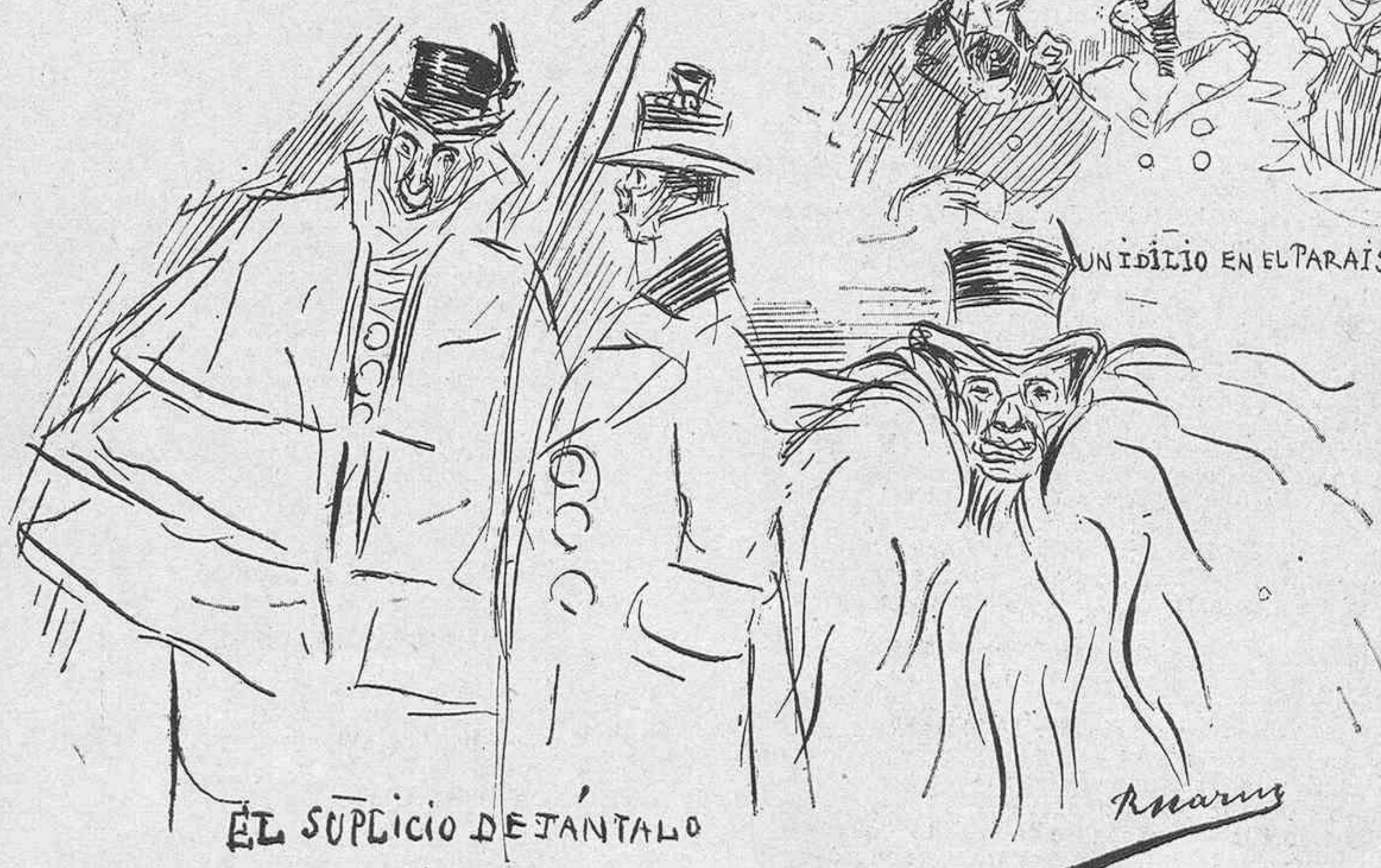
EL SUPPLICIO DE JANTALO