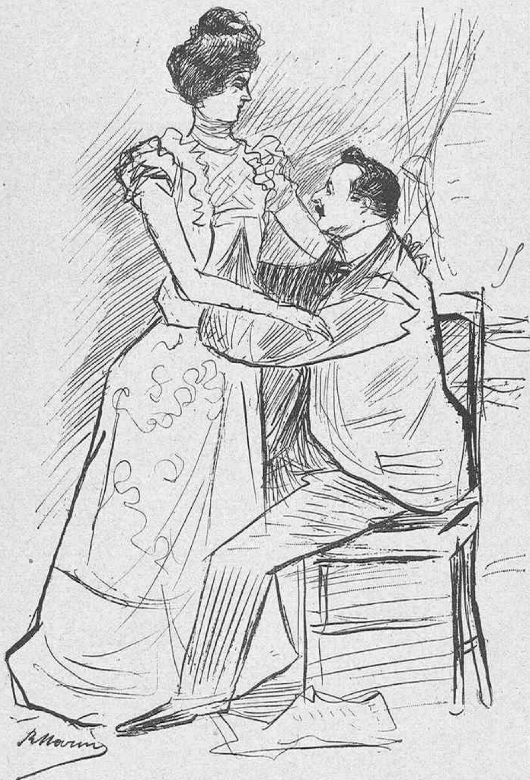
(Dibujos de MARÍN).