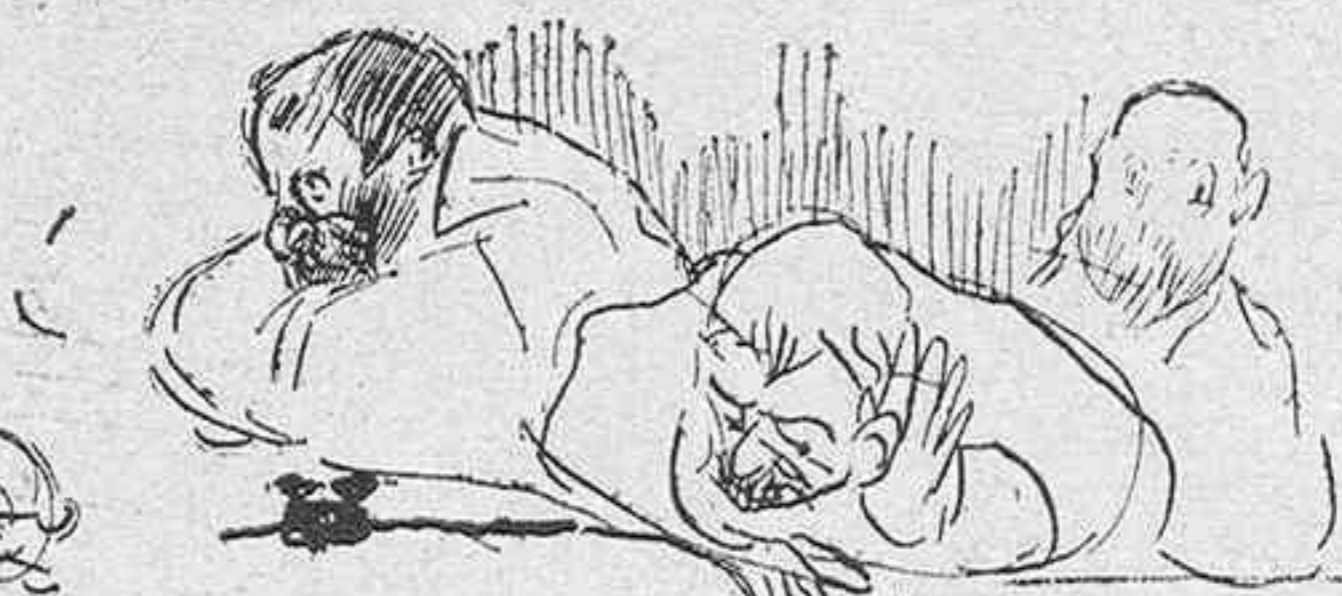
LOS QUE SE CREEN LOS VERDADEROS ABIGONADOS