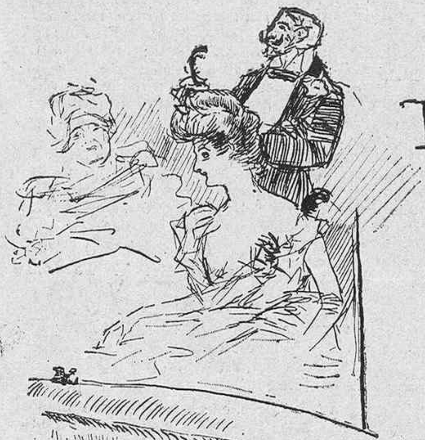
Los abonados de siempre.