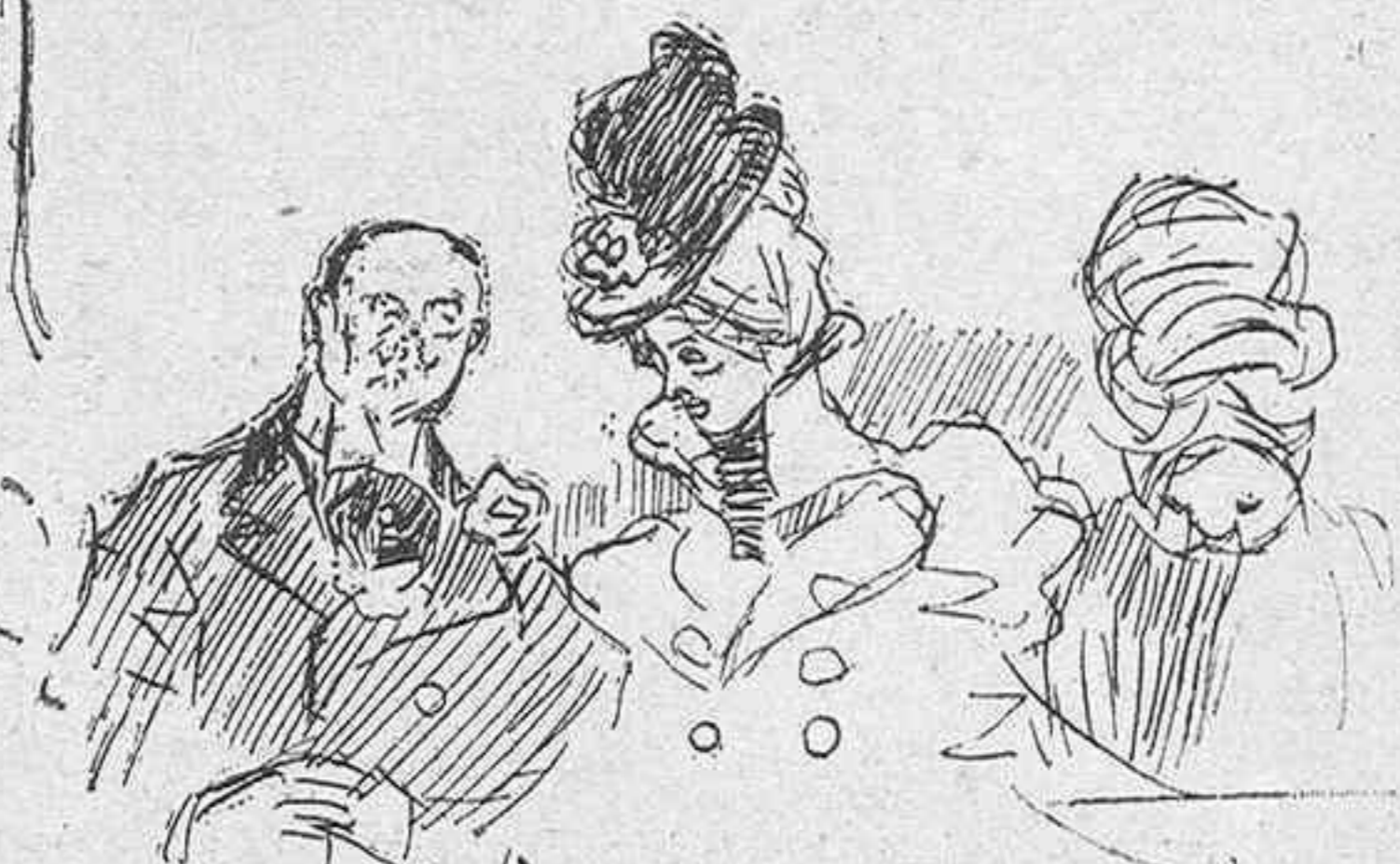
UN IDILIO EN EL PARAISO