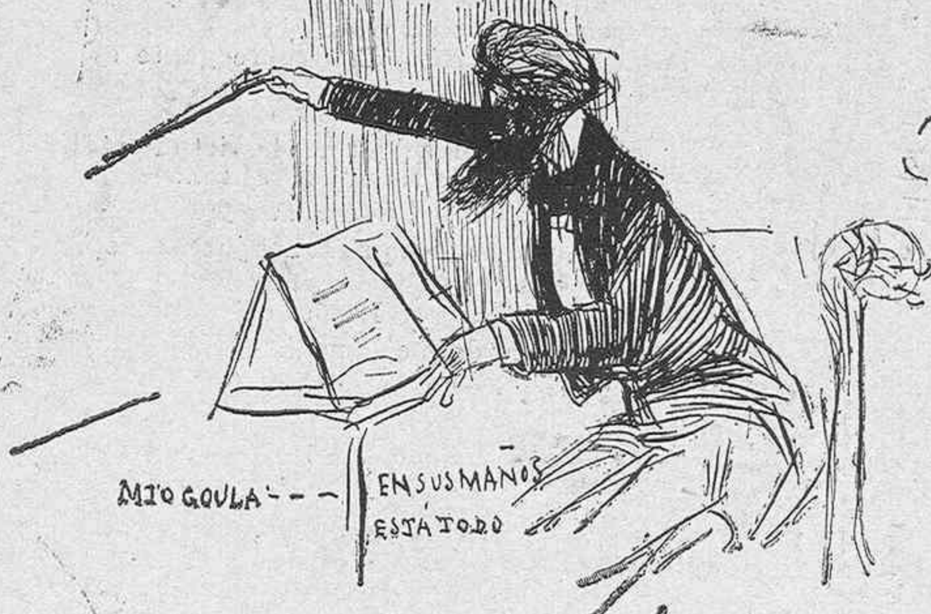
MIO GOULA --- EN SUS MANOS ESTÁ TODO