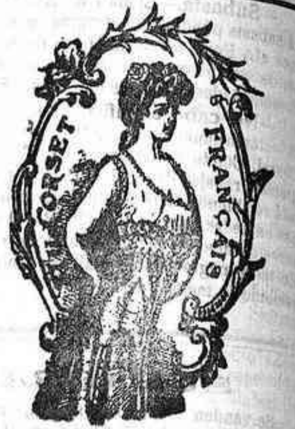
PLAZA DEL ANGEL, NUM. 8 CORDOBA

EXPOSICION PERMANENTE DE TODA CLASE DE MÁQUINAS