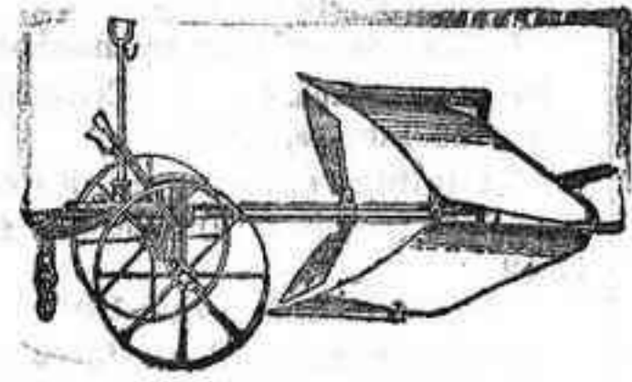
Arado Brabant Melotte

ARADOS Brabant MELOTTE y RUD-SACK. CULTIVADORES Planet.—GRADAS de muelle. SEMBRADORAS "San Bernardo", con cajón. DISTRIBUIDORA de abonos.—TRITURADORES de Grano— Abono y CORTA-FORRAJES.