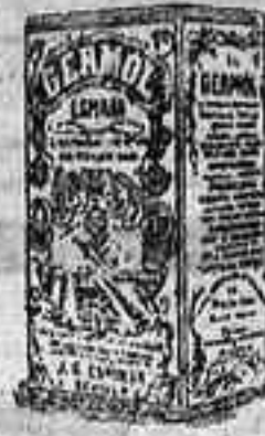
Facsimil de las latas decoradas

INDISPENSABLE EN LA HIGIENE PUBLICA Y PRIVADA