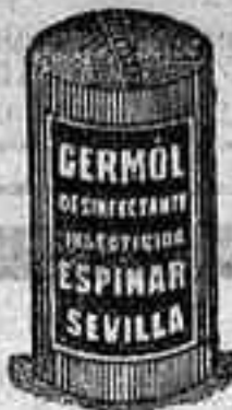
Facsimil del bote de hierro de 23 kl.