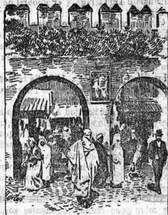
Entrada al zoco grande de Tánger