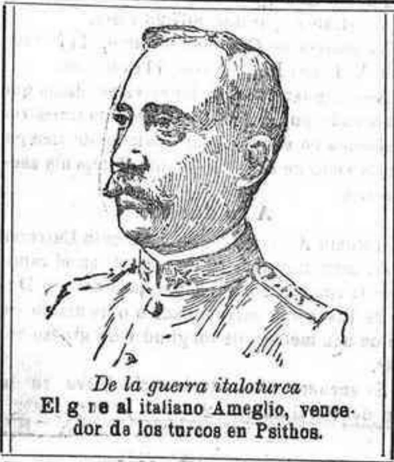
De la guerra italo-turca. El general italiano Ameglio, vencedor de los turcos en Psithos.