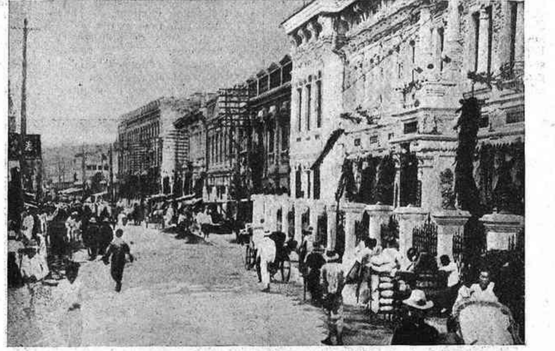
Carrer del barri modern de Kharbin

de l'autonomia i en comptes d'això es posà sota la jurisdicció de la província de Heilungkiang i introduït un sistema prefectoral. En els darrers anys, però, la propaganda soviètica a la Mongòlia Interior, d'emancipació dels pobles oprimits, que és duta a terme des de la Mongòlia Exterior, ha estimulat el desvetllament nacional d'aquest poble, i hi ha hagut moltes intrigues i motins a Kholumbair per a la realització de la Més Gran República Mongol gràcies a la unió d'ambdues Mongòlies.