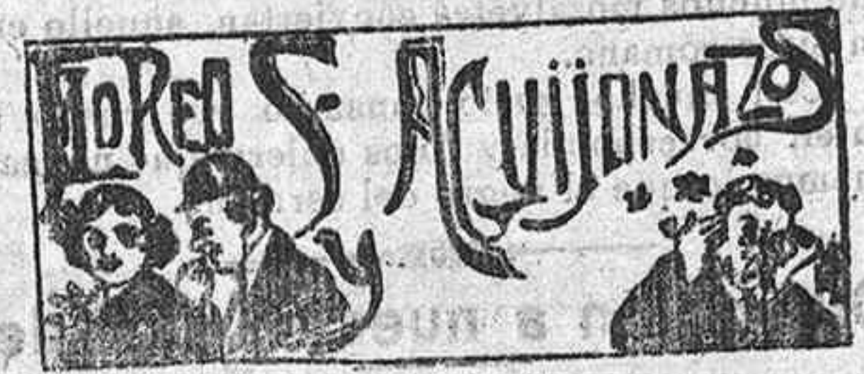
La cosa está que arde

Descanse en paz y reciba su familia el más sentido pésame.