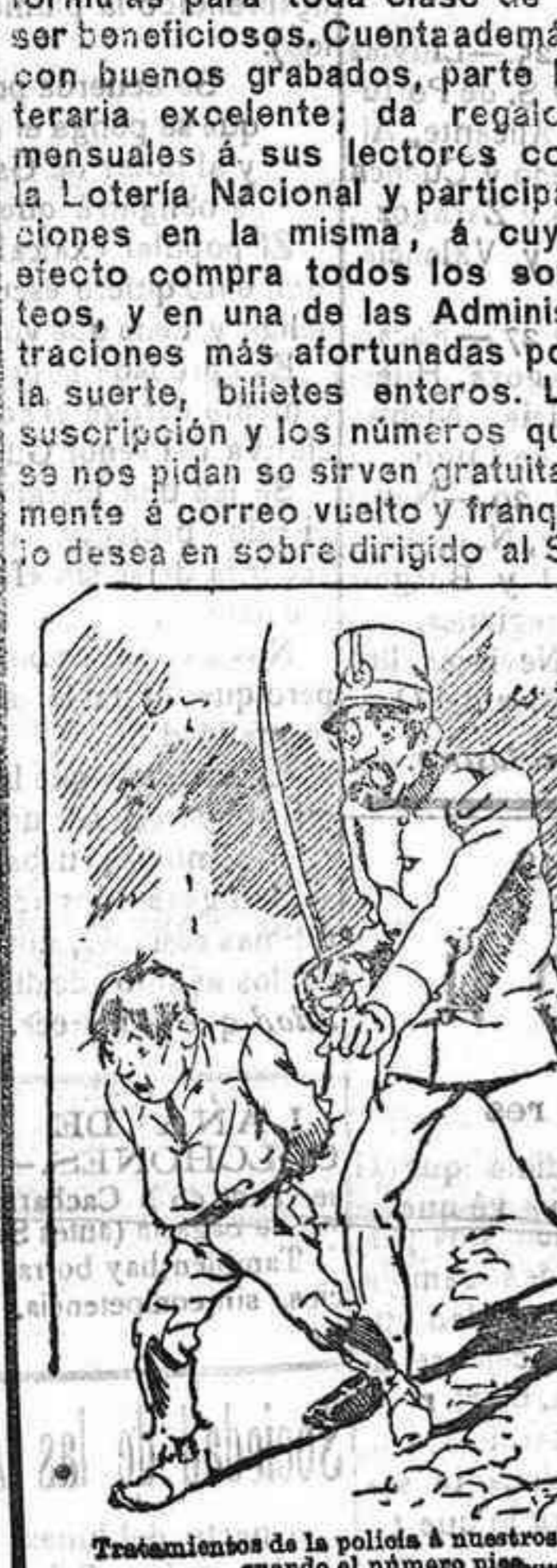
Tratamientos de la polidía á nuestros vendedores cuando el número pisa...