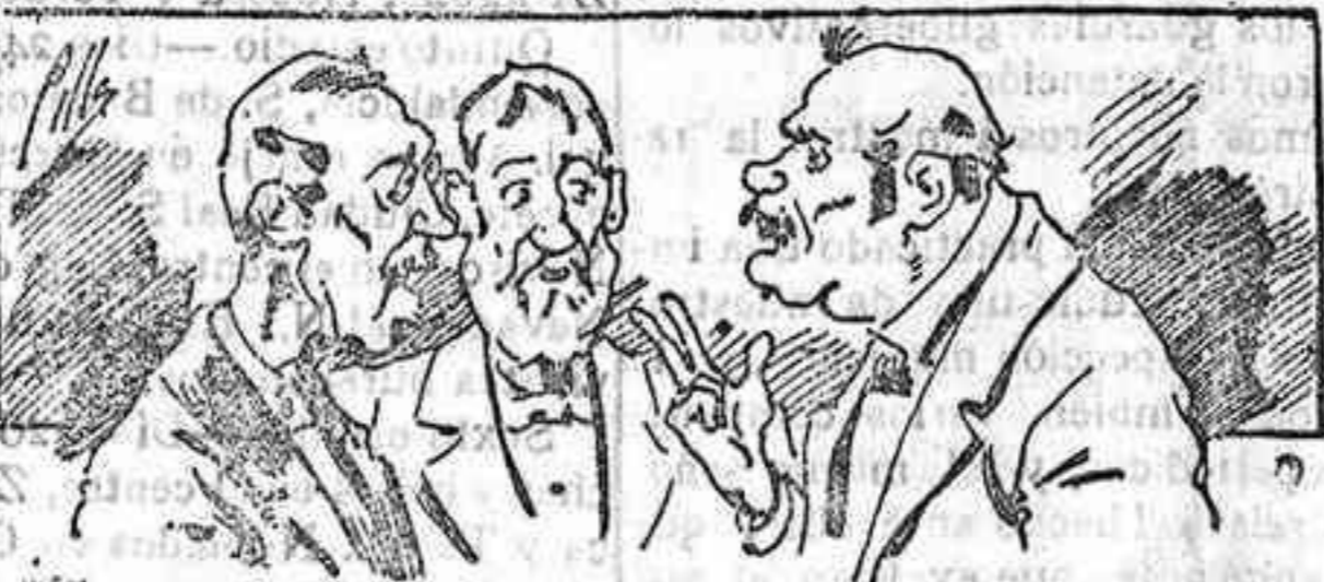
Abominan á nuestros libros... pero los compran.

Todas las personas de gusto, curiosas é ilustradas deben pedir al Director de LA AVISPA, apartado núm. 8, MADRID, un ejemplar que se remite gratis y franqueado. Esta Revista Enciclopédica Popular publica recreaciones científicas, recetas de cocina, repostería, confitería, vinos, licores, pinturas, barnices, betunes y cuantas noticias y conocimientos puedan ser beneficiosos. Cuenta además con buenos grabados, parte literaria excelente; da regalos mensuales á sus lectores con la Lotería Nacional y participaciones en la misma, á cuyo efecto compra todos los sorteos, y en una de las Administraciones más afortunadas por la suerte, billetes enteros. La suscripción y los números que se nos pidan se sirven gratuitamente á correo vuelto y franqueados, con sólo indicar el nombre y dirección de la persona que desea en sobre dirigido al Sr. Administrador de